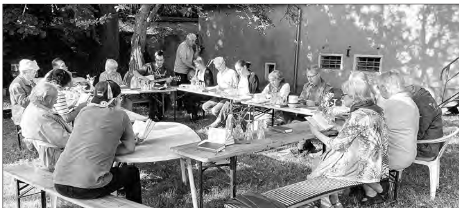
Zhromadny spěwanski wječork Hodźijskeje a Rakečanskeje Bjesady w juliju 2022 na Hodźijskej farskej zahrodze

Bjesadze njeje so dotal dosć poradziło, wliw na serbskorěčne kubłanje džěci wuknjeć, zo by tež w přichodze w Hodźiju zaklinčała chwalba Bohu w rěči našich prjedownikow a zo bychu so ludžom jich serbske korjenje wuwědomili. 2013 zwrěšći zhromadne prócowanje Bjesady a skupiny staršich, w Hodźijskej zakładnej šuli z pomocu projekta „2 plus“ wukubłanje šulerjow w serbskej rěči znowa strukturować a tak na wyši niwow pozběhnyć. Wot Domowiny njejsmy při tym bohužel žanu skutkownu podpěru dóstali. Budyska župa bě nas informowała, zo móže a dyrbi so, hdyž je dosć šulerjow, tež w Hodźijskej šuli po projekće „2plus“ džělać. Wobstarachmy zwólniwość staršich a džěci. Na rozsudnym posedženju w gmejnje pak je Domowina, zastupjena přez knjeza Statnika wosobinsce, wotpokazanje šulskeje ⇨