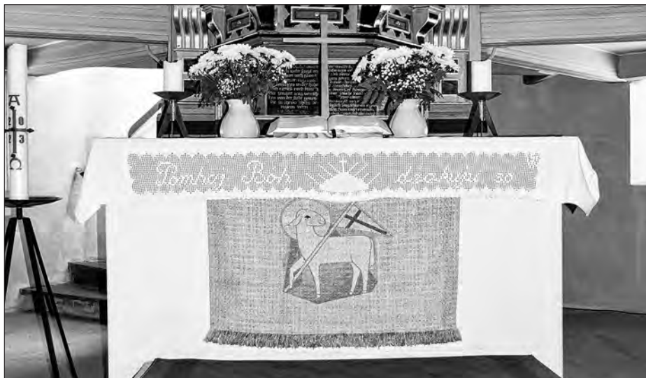
Wot Sigrid Wërikoweje z Hermanec w léce 2018 zhotowjeny rub za wołtar w Rakečanskej cyrkwi z napisom „Pomhaj Bóh – dźakuju so“.