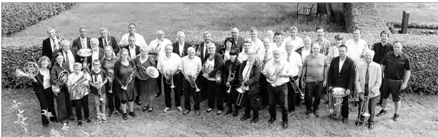
Dujerjo z Poršic a wokoliny po swjedźenskich kemšach 26. meje skladnostnje stolětneho jubileja Poršiskeho pozawnoweho chóra