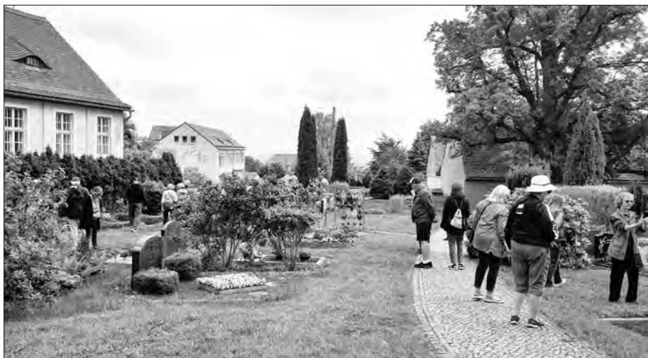
Po wopyće Bukečanskeje cyrkwy so wopytowarjo z Texasa po kěrchowje rozhladowachu.