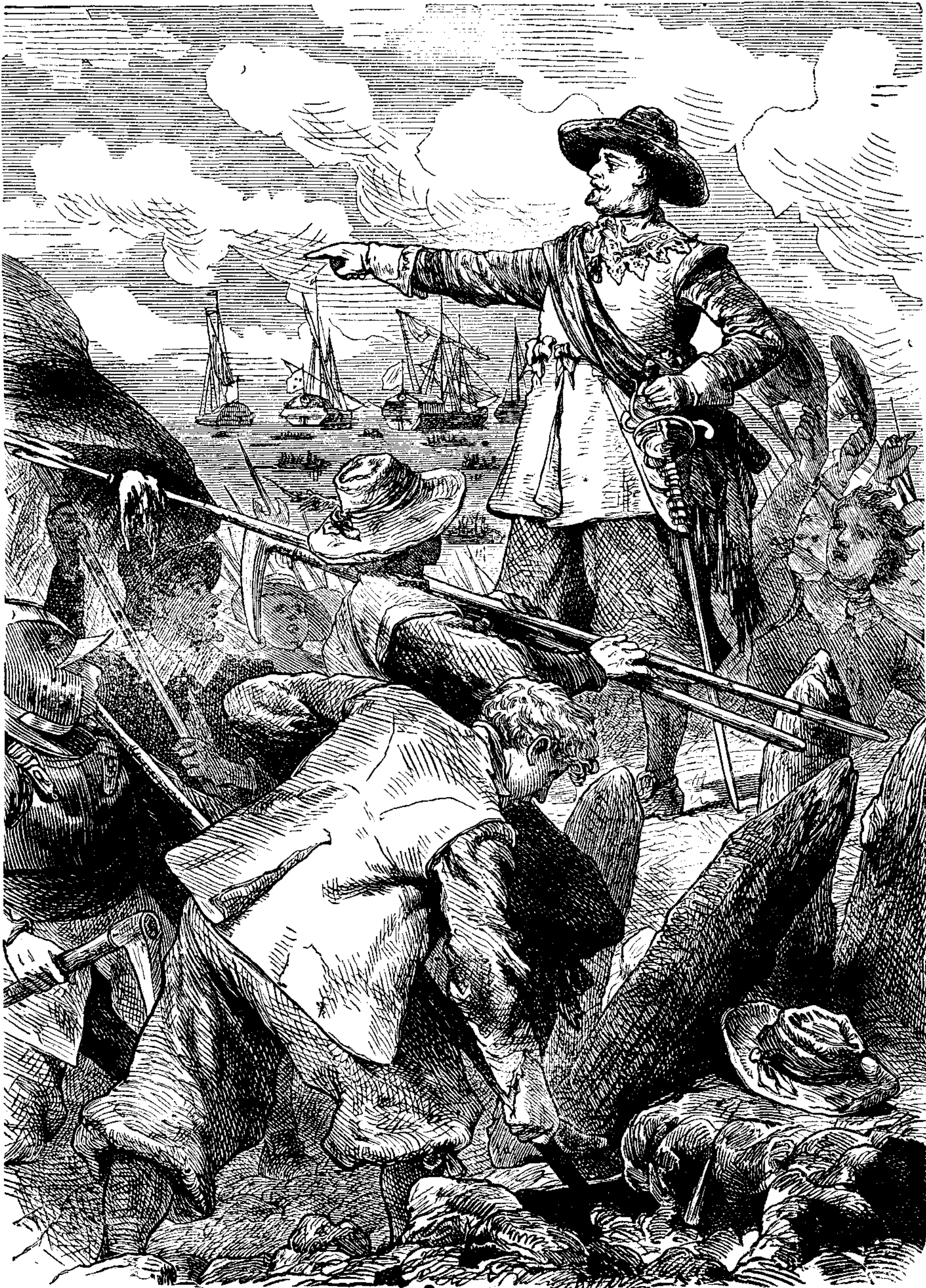
Gustav Adolf stupi na brjóh naskeho wótznego krala.

skaz bješami, ja tebe došč kšwalicz njesamóžu sa twoje hnadne wobarnowanje hač sem, ja so tebi džakuju. Ty wěšč, so bym tu pšchiczahnył niž k mojej, ale k twojej čžesczi a twojej podczisčžanej zyrkwi na pomoc. Daj mi tež dale sbože, twój kšwaty štuf wumjesč hač k temu kónzej, tiž je wot tebe postajeny. Šamjen.“ Jako kral postany, widžesche, so něotfi pšafachu, wón pak praji: „Njepšafajče! Kadišo proščje! Sčtož k wěru prošč, ma pot dobyče!“ Njepšhecžel nihdže widžecz njebėsche. Hač runje bėchu na 16000 thěžoriskich wojakow w Pomoriskej, Gustav Adolf nještupi. We Sčžeczinje bėsche Pomorski wójskoda Bogisław. Wón kėsche kšaby muž a čžywiče směrou žiwny bneč. Duž tež s Gustav Adolfom ničo čžinicž mēčž nječaiče, so njeby jemu thěžor na kšiju pšchichot. Lud pak kšaratašche kšwejeho wumozerja powitacz. Gustav Adolf kšebi bōriw wutrobny luda se swojimi pšhecžinym waschnjom dobu. Bogisław naradšcho Gustav Adolfej město Sčžeczin wotewri njeby, ale Gustav Adolf jemu stóncznje s dobrym ničo njewusłutkowawšči hrožo pšchiwola: „Sčtož so mnu njeje, tón je pšhecziwo mi!“ Na to praji Bogisław: „Duž dha w Božim njenje!“ a Gustav Adolf do města pšchiczahny. Thěžor pak so rošhori wo tym šhoniwšči, so je so Pomorska Gustav Adolfej pšchiwobrocziła. Wón poruczi, wójskodu Bogislawa sa pšcheradnika wótznego kraja wobhladacz.