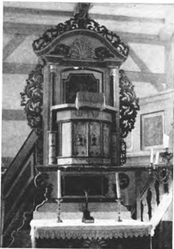
Woltar w Blunju