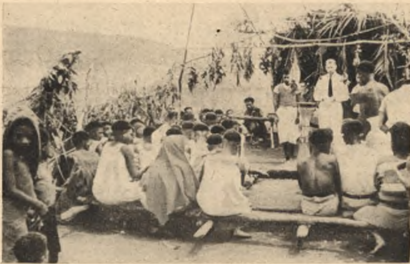
Do najzanjesenišich krajow pučuja misionarjow, zo bychu słowo wo Božim kralestwje wšěm ludžom připowědali. Tu widźimy křćenicu w Finistererskich horinach w Nowej Guineji. Bóle na prawo widźimy misionara před dupu stej a zady njeho jednorj woltar z haluzow.

Nakładnistwo Domowina. – Licenca č. 733 Wuchadza jónkróc za měsac. – Rjaduje Konwent serbskich ewangelskich duchownych. – Hłowny zamolwity redaktor: superintendent G. Wirth - Njeswaćidlski Čiść: III-4-9, Nowa Doba, čišćernja Domowiny w Budyšinje