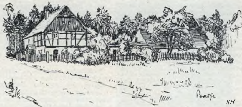
Korčma při kromje chójnow w Psowjach (Minakalska wosada)

Budyšin. Póndzelu, 23. 2. 1970 mějachmy zaso swój kublanski džěń. Njeđziwajcy jara špatneho wjedra bě so rjana ličba swěrných Serbow w Budyšinje zešla. Što smy wšo slyšeli a sebi rozpominali, wo tym pisamy nadrobnišo w přichodnym čisle.