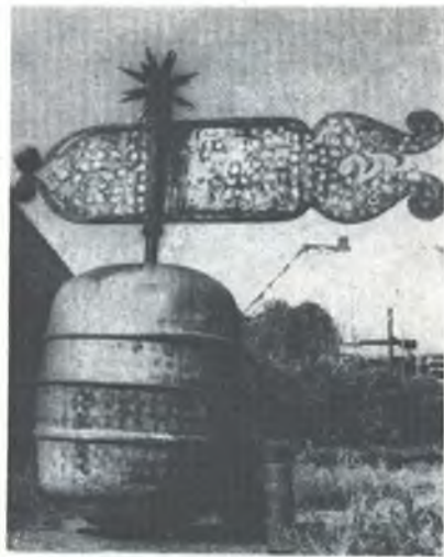
Kula z Bukečanskeje wěže

my do bliskeje wsy Jaworze na kemše. Tam je z fararjom bratr Ryszard Janik. Slonco so hdys chowaše. A tola sej móžach pisane wobrazki zhotowić, kiž sej rady wobhladam. Widžu tam, kak so wosada, tež zдалoka přichadźaca, zhromadźuje. Čłowjekajo njesu na posledni wokomik přichwatili, ale su sej chwile wzali. Steja tam před Božim domom, žony zdžěla w narodnych drastach, a so rozmoľwjeja. Čakaja na zwonjenje a potom kroča do swjatnicy. Boží dom je tež w najlěpším porjadku. Tu njebě swjedźenska, ale njeđzelska Boža služba. Jimani buchmy zaso wot žiwosće