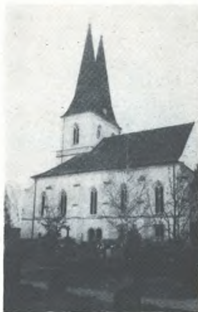
Rjenje wobnowjeny Hodžijski Boží dom

Pomhaj Bóh, časopis ewangelskich Serbow. — Wuchadza jónkróc za měsac z lilencu č. 417 Nowinarskeho zarjada pola předsydy Młhisterskeje rady NDR. — Rjaduje Konwent serbskich ewangelskich duchownych. — Hłowny zamółwity redaktor: superintendent Gerhard Wirth - Njeswaćidlski. — Ludowe nakładnistwo čišćerjny Budyšin. — Čiště: Nowa Doba, čišćerjny Domowiny w Budyšinje (111-4-9-2006)