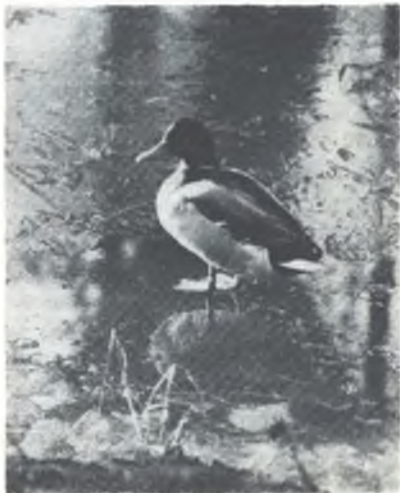
Bórže budžeja kački zaso po zymnym lodže chodžić. Wužiwajmy poslednje ćopje nazymske dny.