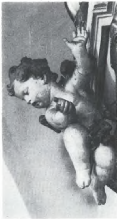
Jandželk w Rakečanskim Božim domje

Spytowany čłowjek je wohroženy čłowjek a sam husto dosć njewě, kak wohroženy je a kak blisko je k swojemu njezbožu, a je drje jemu bliši, čím mjenje sam sebje pónzawa, swoju samsnu wopravdži-