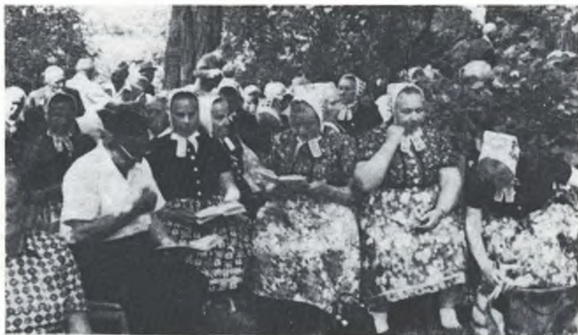
Serbski cyrkwinski džěno so bliži. Budžeće tež w Rakecach mjez nami w swojej rjanej serbskej drasće, wy lube Slepjanki a Wojerowčanki?

Z časom tutym sylam njedosahaše, zo so čłowjekojno jenož tak zabiwachu. To běše jim přeskřotka. Tak najimachu pantomimu, kotryž jenož najprjedy činješe, kaž by byl smjertnje zranjeni a so w smjertnych bolosćach wiješe, a na koncu potom jednoho druhého zawěrnje do smjerće krjudowachu. Tak možeše so kóždy smjertnych styskow nahladac.