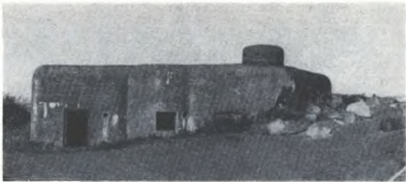
Zawostajila je nam wójna tu a tam hrězbné bunkery, za miliardy drohich pjenjow na škodu ludźi natwarjene.

Koždy wosadny pak njech nutrnje posłucha na předowanje Chrystusoweje cyrkwe a njech so modli wo swoju wěru a wo wěru cyleje cyrkwe.