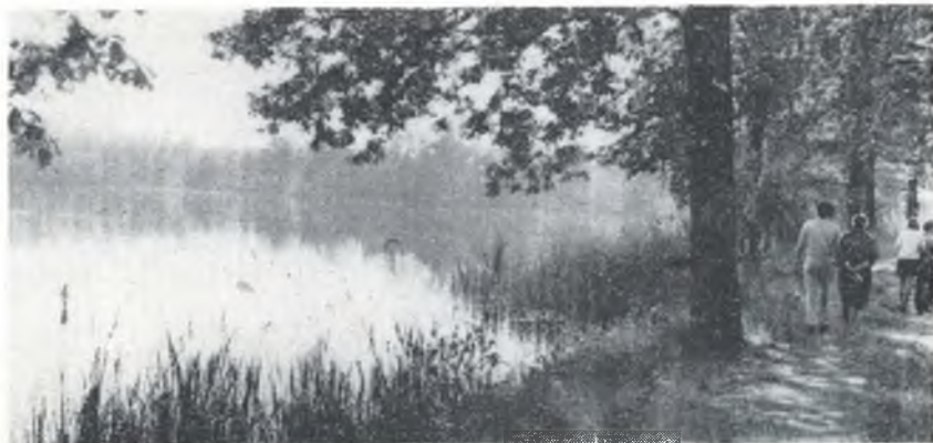
Mile nazymske stónco wabi na čiche haćenja

wo tydžen k blidu: Wšitkich woči čakaja na tebe, a ty dawaš jim jich jědž w swojim času. Ty wotewrješ swoju ruku a nasyciš wšitko, štož je žiwe, po swojim spodobanju. (psalm 145, 15 a 16)