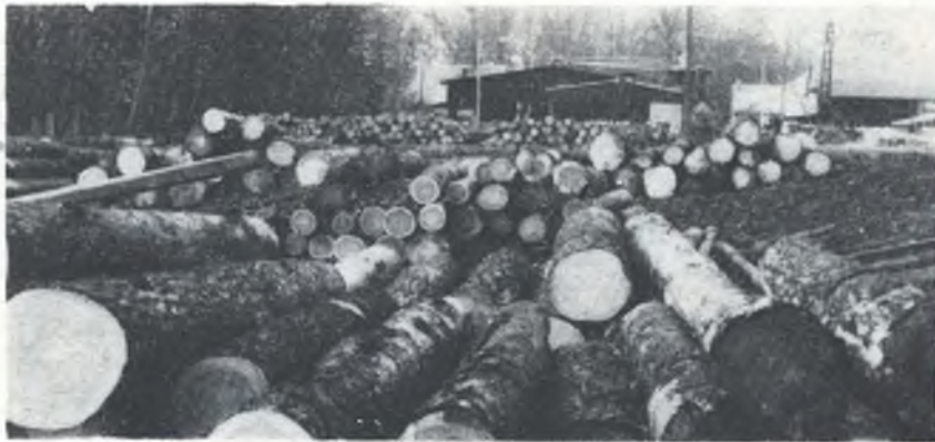
W lěsu su přez cyle lěto žně.

Nowu přikaznju wam dam, zo byšće so mjez sobu lubowali, kaž sym ja was lubował. Tule přikaznju je nam Boh dał přez swojeho Syna.