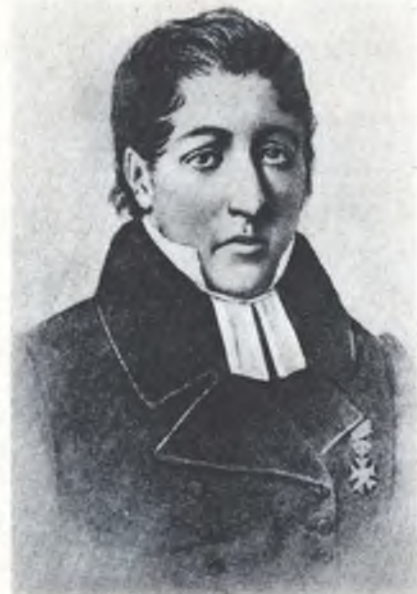
L. L. Laestadius, ewangelista mjez Lapami