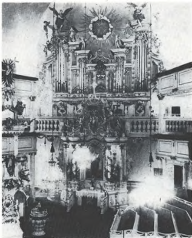
Krasne barokowe pišćele w Cieplicach

Někotre lěta pozdžišo připowěduje Samathanariva sam Bože slowo — swojemu ludu, tež swojim při wuznym a předewšem swojimaj staršimaj: z rubježnikow buchu měrni a pilni burja. Zeserbšćit: hš.