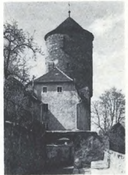
Cichi kućik za měšćanskej murju