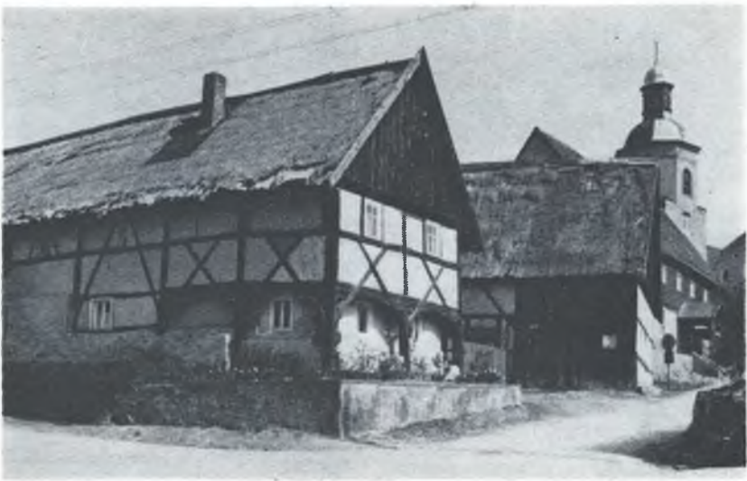
Stary statok w Hrodzišću