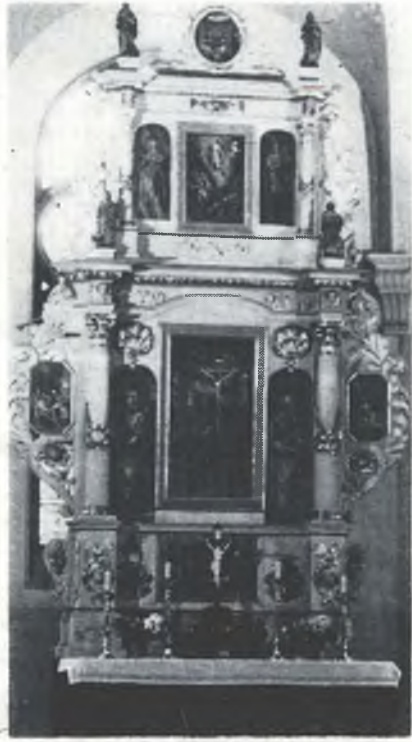
Wottar w Budestecach

zo Jězus přepozdže přindže, dokelž běše jeho žena z krejnej chorosću zakomdžila. Tak tež my njesćerpnje na pomoc čakamy a so w swojej malej wěrje bojimy, zo je hižom přepozdže. Jairus je Jězusowu pomoc nazhonil — a ty snano tež, hdyž běše w čěm-nym dole. Runje w čěsnosćach je wón pola nas a ma našu wěčnu zbožnosť na starosći. Bóh nas dźerži w najwjetšej nuzy. To nam kniha Hiob tak rjenje wopisuje. Jězus nam praji: