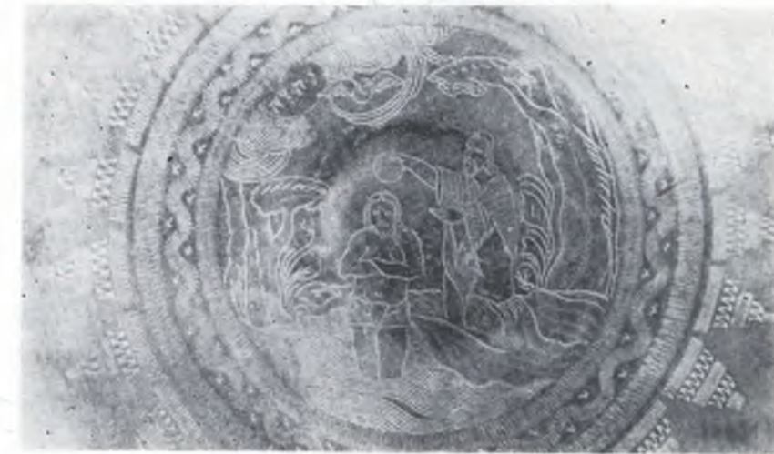
Budyšink — wobraz w dupnej škli: Jan Křćenik křćije Jězusa

14. septembra 258 jeho zajachu a přeslyšowachu, ale hižom po krōtkich słowach jeho zasudžichu. Zaslyšawši wusud scicha zdychny: Deo gratias — Bohu budž džak! Wosada jeho přewodžowaše na wotprawnišćo: „My chcemy z nim wumrēć.“ Přišedši tam wōn swōj kabat so sleče, so poklakny a so modlēše. Hdyž kat ze sekeru přiřdže, wōn jemu za jeho džělo 25 zlotych zaplaći. Wěrjacy pak wokoło