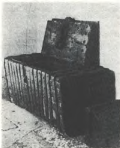
Zajimawa křinja w Njeswačidle z hoberskeho duboweho zdónka wudypana a ze železnymi bantami wobdata

Pomhaj Boh, časopis ewangelskich Serbow. — Wuchadza jónkróc za měsac z licencu č. 417 Nowinarskeho zarjada pola předsydy Ministerskeje rady NDR. — Rjaduje Konwent serbskich ewangelskich duchownych. — Hłowny zamolitwy redaktor: superintendent Gerhard Wirth-Njeswačidski. — Ludowe nakładnistwo Domowina, Budyšin. — Čišeć: Nowa Doba, čišćerňa Domowiny (III-4-9-519)