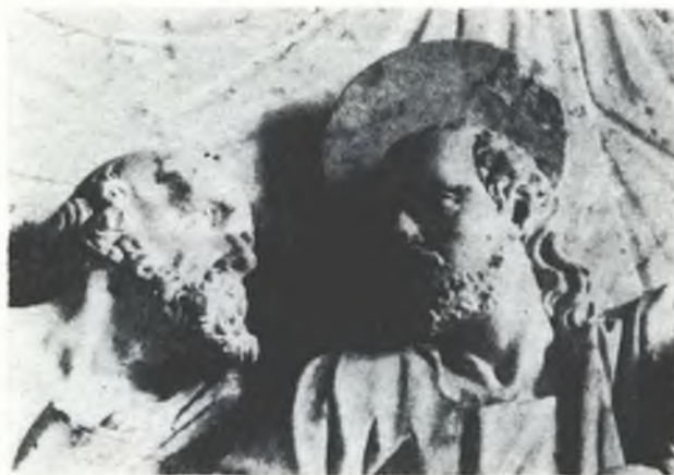
Knježe, sym to ja, kiž tebjje přeradží? Džěl z wotarneho reliefa w Njeswaćidle