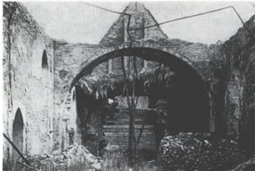
Jako tajku ruinu nadeńdžechu Boži dom, hdyž so Njeswačeno po wójnje dom wrócihu

„Lačonsce — čehodla lačonsčinu wuknyć? Prjedy tule hólcy Jednoty tež njewukna njewuknjechu. Tak powědaše nam džěd.“