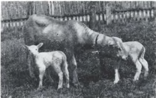
Wowcy z pastyrjom su swobodniše hač bjez njeho!