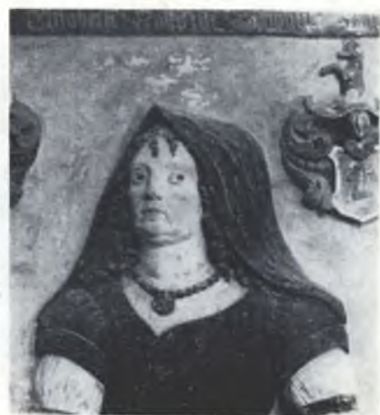
Epitaf w Budyšinku

Twjerdžić, zo wěrju do žiweho Boha, a rěčec jenož wo zhromadne žiwjenje morjacym derjeměću, je napřećiwk! Snadž je to nastork k rozpominanju!