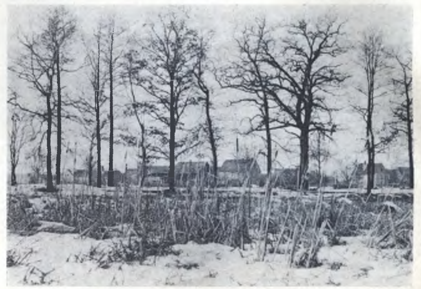
To je Jitk: Serbja a Němcy, ewangelscy a katolscy a ateisća bydla tam přez jedni hromadže!

Hdyž wón samlutki wosrjedž lódzymnje, prózdneje katedrale kleči,