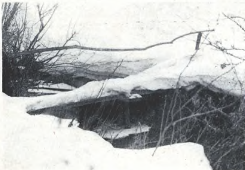
Mosty zwjazuja čłowjekow!