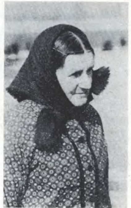
Serbowka z Wojerowskich kónčin