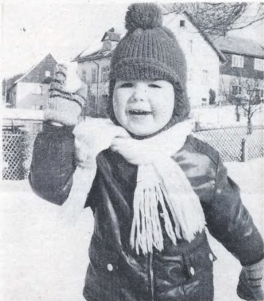
Wšěm našim džěcom a jich staršim rjane prózdinske dny z telko sněhom, kaž ma jón tutón hólčik!

Najprjedy chcu naspomnić, wosebje za tych, kiž tute hesło snadź z nowym katolskim přeložkom přirunuja, zo tam steji: „... chce, zo bychu wšitcy ludžo zbožni byli a prawdu poznali.“ Po grjekskim originalu hodži so tež přeložić: „... zo bychu ... wumóženi byli“ Měrcin Luther je so w swojim přeložku rozsudił za powšitkowniše slowo „pomhać“ a w tutym přeložku, kaž steji wone w nadpismje, je tuta sada Noweho zakonja hrono přenjeho lěta noweho, najskerje za cyłe člowje-