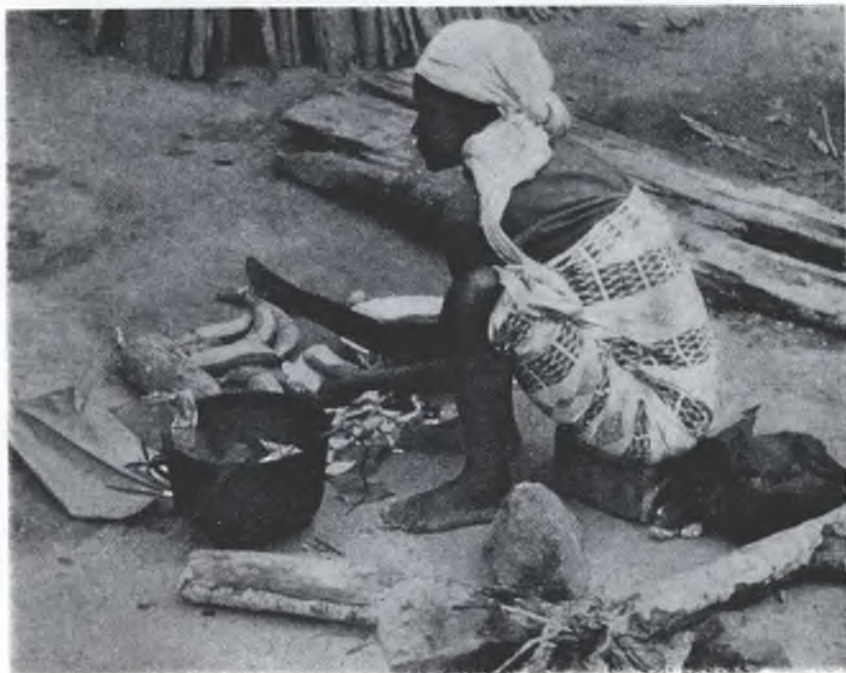
To je kuchnja chudych! Přirunujmy ju z našimi!

To njeje lochki puć. Wón móže k tomu wjesć, zo njerozeznawaja so křescenjo hižo wot chudych džensa. „Wučobnik njeje nad mištra, ani wotroček nad knjeza (Mat. 10, 24)“. „Mision pod křižom“ — husto wuži-