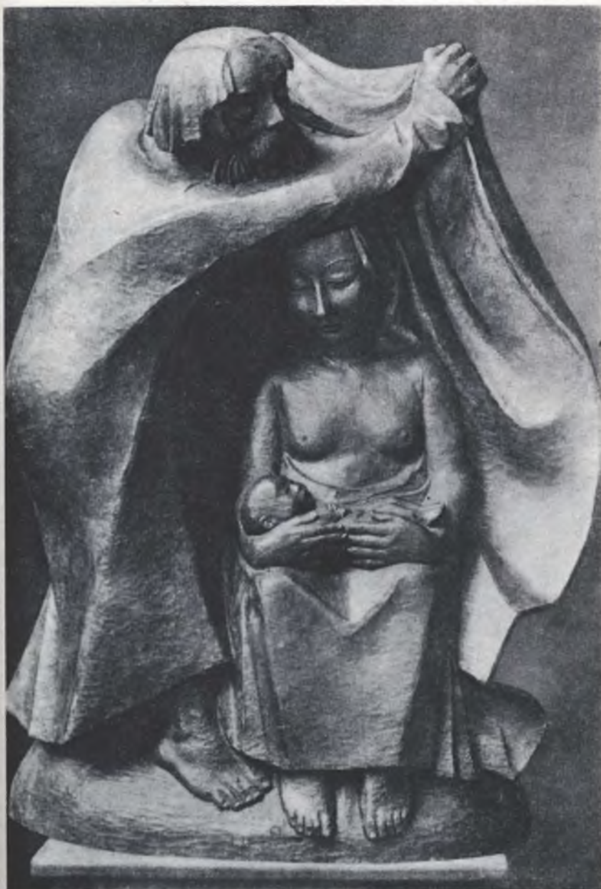
Ernst Barlach: Wotpočink na čekanju (1924)

Bibliska wědomosć je wuslědźila, zo je profeta tuto tróštno słowo wurudženym Židam w Babylonskim zajecu prajił. Měr je wěšćenym tym, kiž su daloko, mjenujcy w dalokim Jerusaleme, w swjatym měsće židowskich wotcow. A měr je připowědzeny tym, kiž su blisko, kiž su hromadze z profetu w cuzym, pohanskim Babylone.