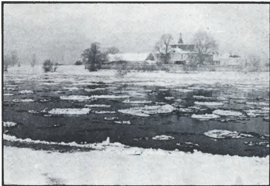
To je Łobjo pola Riesa z wudworom Promnitz

džensa kaž dostojne stołpy w dalokej zelenej žurli, škitaja nahly a pšokjoty pobrjóh před wichorom a žolmami. Wosrjedž štomow wuhladamoj nadobo hoberski kruch betona: Něhdyše zepěranišo fašistiskeho wójska, po pospyće rozbuchnjenja mučnje dozady nachilene, wudžera kaž přemy-