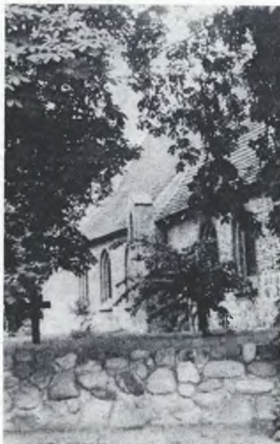
Wjesna cyrkwička w Koserowje

Wjesnu cyrkej w Koserowje móžeš lédma fotografować: murja z pólnych kamjenjow, kajkež w cyrkwinej wěži zaso widžimy, a wysoke kastanije wobstrážuja cyrkwičku, w kotrejž zahraje za někotre dny nadarjena mloda organistka z Lipska. Twar pochadza z 13. lětstotka, zažnogotiske murje, pózdnojogotiske drjeworěžby. Snano je w sakralnym twarstwje woneho časa tež jeho duchowny njeměr widžeć, wulki pohib mjez ludami a naladami, mjez bohami a Bohom, mjezy Słowjanstwom a Němcow-