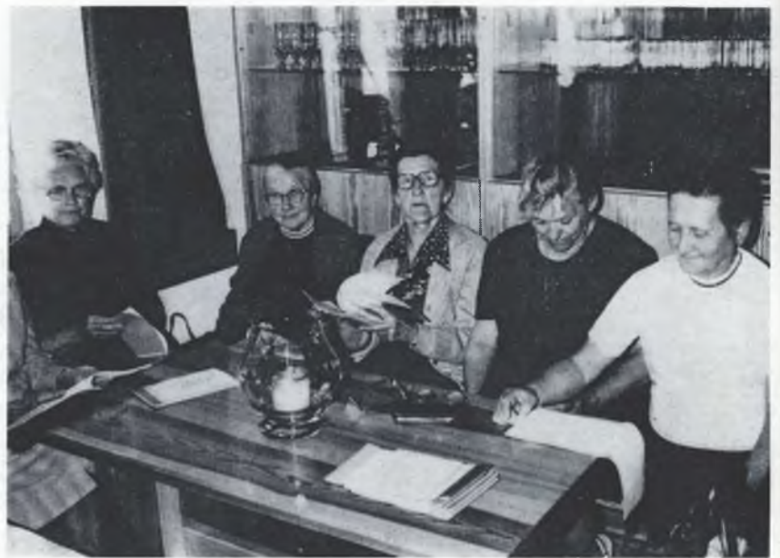
Wopytowarki „Popołdnja za starych wosadnych“ w Rakecach

Najzajimawše a česćehódne pak w Hrodzišću zawěšće nazhoniš, hdyž stejiš před něhdyšej šulu, w kotrejž matej swoje sydło Rada gmejny a nawodnistwo prodursta. Z nahladnym přitwarom su před lětami cyły objekt mócnje rozšěrili, jón zwonka a znutřka dospołnje wobnowili a cyľemu twarej dali porjadny wobmjek. Nowy zachod wjedže do domu – stary