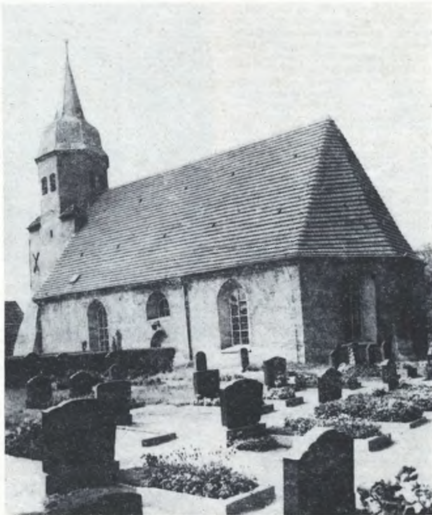
Cyrkej w Lejnje pola Łutow (Geierswalde)

Jězús běše wulki rjek, kiž chcyše za chudych wustupować, ale bohaći tehdomnišeho časa jeho zamordowachu. Abo so praji: Jězús je mudry wučer čłowjestwa, kiž chcyše lud k lěpšemu wukublać, ale čłowjestwo to njespózna a jeho mori. Abo druzi praja, zo je Jězús załožer wulkeje nabožiny, kaž na přikład tež Mohammed, a je za swoje ideje do smjerće šol. Tajke abo podobne wotmołwy drje bychmy džzensa na naše prašenje dóstali. Ale wšitke tute wotmołwy maja to jedne zhrmadne: Woni su čłowjeske přemyslowanja a nahlady. Z tym runaja so tym, štož wo Pascalu a matematice prajach. Ale što to mje stara? Hač je Jězús abo mudry čłowjek abo załožer wulkeje nabožiny abo něšto podobne, to drje je zajimawe prašenje w diskusiach. hdyž so wo tym reči, što wo Jězusu myslimy, a wo tym so da wulkotnje rečeć, ale hdyž je diskusija nimo, wostanje wšo, kaž je prjedy było. Z mojim žiwjenjom to nima ničo činić. Jězús