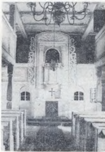
Cyrkej w Ptačecach znutřka

Ptačecy rěkaja němsce „Tatzschwitz“ a Lejno „Geierswalde“. Wobě