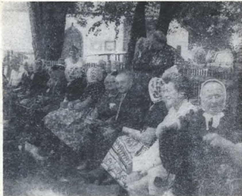
Slepjanki a druzi wopytwarjo cyrkwinskeho dnja 1981 w připoldnišej přestawce