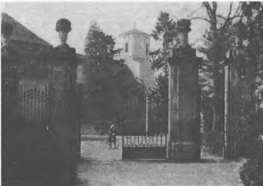
Pohlad z parka w Njeswaćidlo na cyrkej a faru (nalěwo)