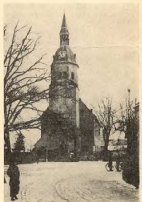
Wulke Zdžary, městno cyrkwinskeho dnja léta 1948.

sebjce swjatosć cyrkwinskih rumnosćow a gratow wuzběhowaše. Tehdom běše so nahladna ličba ewangelskich Serbow ze wšech koncín zešta, přez 600 běše to na kóždy pad.