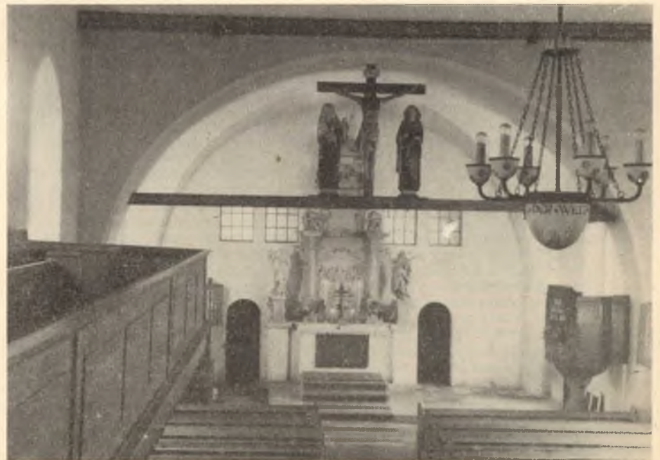
Njeswaćidło, hdžež so lěta 1949 wotměwaše cyrkwinski džeň. (Tehdom běše znatřkowny napohlad pak hinaši).

Z tym, zo farar na koncu božeje služby wosadnych žohnuje, wón jenož nje-preje, zo by Bóh tež potom z wěrjacymi był, hdyž nětko boži dom wopušća a so domoj wróća, ale wón z tym bože žohnowanje wudžěla. Druhdy so to samo přez napoloženje rukow stawa, kaž při křćenju, při konfirmaciji a při wěrowanju. Z tym so praji: Žohnowanje rěka, zo je Bóh ze žohnowanym. Wězo to njerěka, zo Bóh přeco a wšudžom pomha a škita, tak, zo so ničo złeho stać nje-može. Ale z tym je prajene: Štož pola Boha wostanje, toho Bóh tež w nje-zbožu njewopušći. Kak so to stawa, to