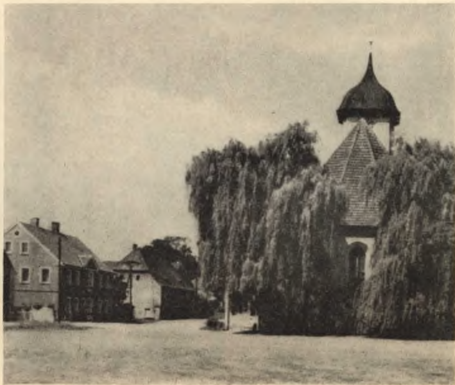
Cyrkej w Malešecach

Rjane slónčne, čopłe wjedro bě wjele kemšerjow do Malešec nawabiło. A na