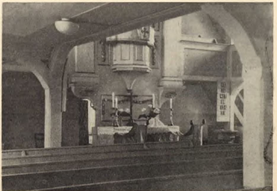
Cyrkej w Poršicach, hdžež wotměje so 30. junija a 1. julija cyrkwinski džěń. Přińdžće na njón!

Wone wšak njeje w němćinje jenož mjeno „Theologische Erklärung“, a tola, Barmen je wuznaće. Wuznaće k Jězuskej Christusej jako hłowje cyrkweje. W přenjej tezy so praji, zo dyrbi cyrkej na