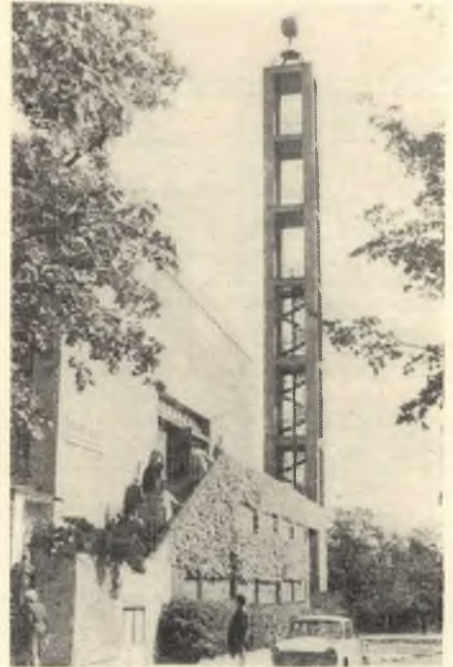
Wosadna cyrkej Českosłowakskeje husitskeje cyrkwyje w Praze na Vinohradach