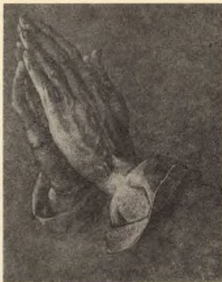
Dürer: So modlacey ruce