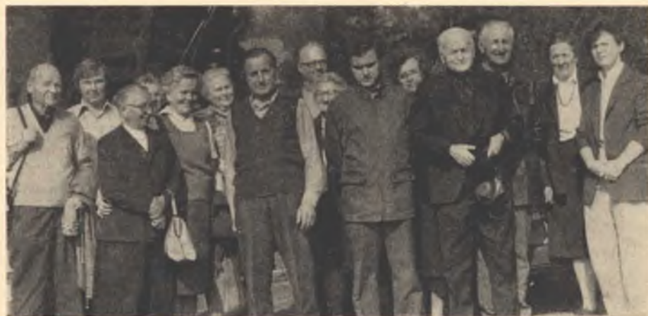
Wobdžělnicy serbskeho tydženja w Janskich Laznjach