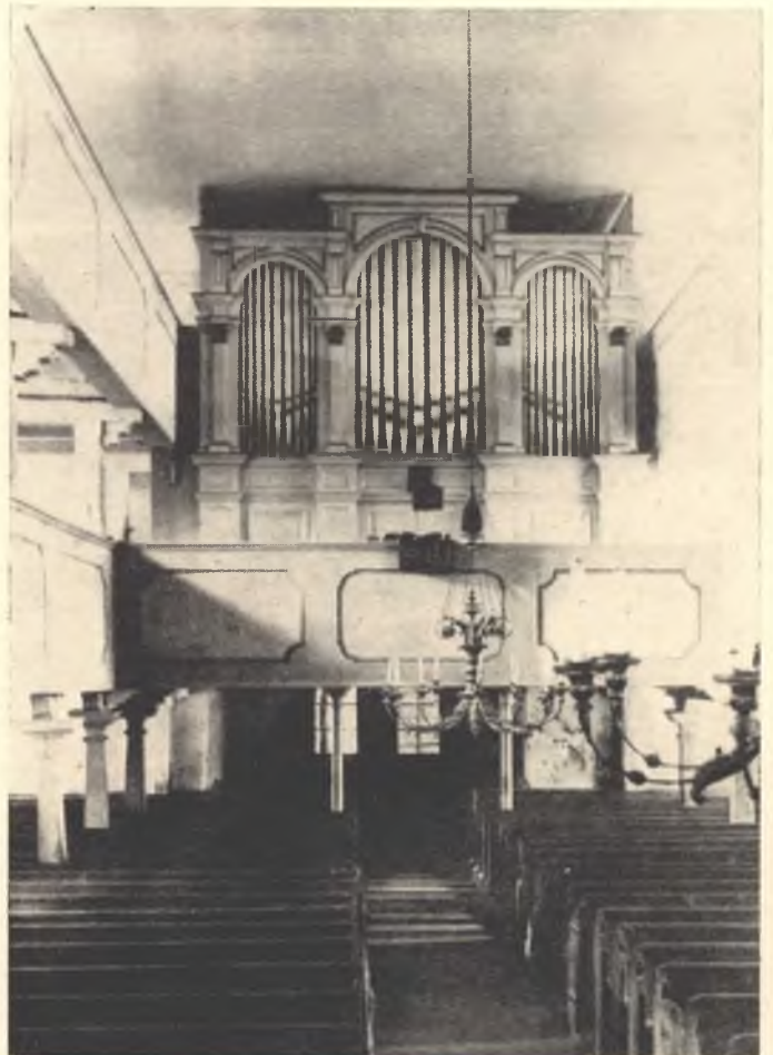
Stara Hrodzišćanska cyrkej w lěće 1902