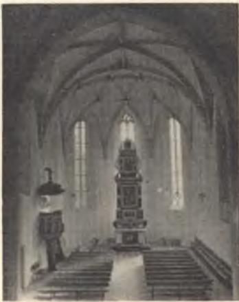
Michalska cyrkej w Budyšinje

Woprawdžite žiwjenje po Chrystusu je prawy zakład, zo móhli sprawnje wuznać: „Ja wěrju do horjestawjanja čěla a do wěčneho žiwjenja.“ Cyril Pjech