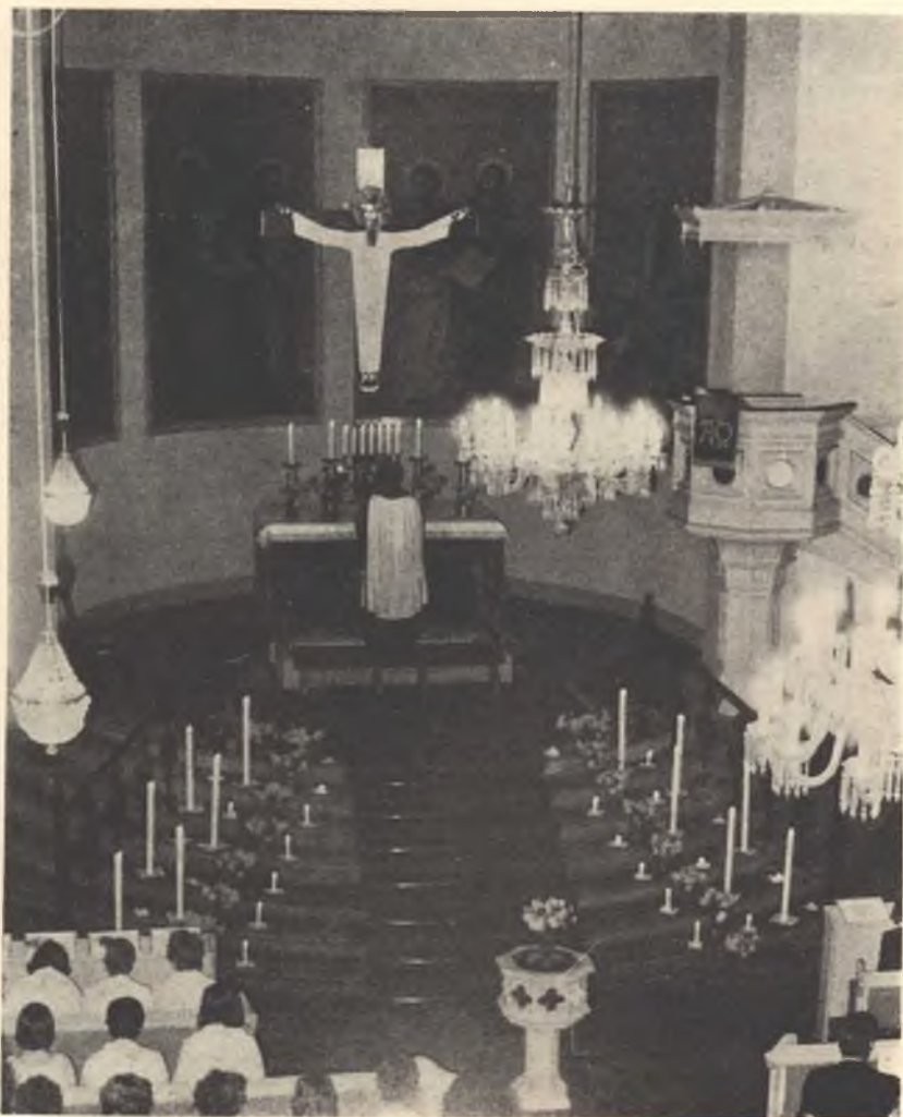
Hač budže Husčanska cyrkej na našim cyrkwinskim dnju tež tak poľna?

Naš čas w Norweskkej so ke kóncej bližeše. Dyrbjachmy so zaso na puć podać. Ale cyle tak jednorje so to nam być njezdaše. Raufoss drje měješe železniski zwisk z Osloom, ale ležeše na hinašej čarje hač Lillehammer — a naše jězdženki plačachu wot Lillehammera do Osloa. Myslachmy, zo dyrbimy sebi nowu jězdženku kupić, ale z čim? Prašachmy so našeho hosćićela, kiž pak nam praješe, zo to problem njeje, dokelž tola jězdženku mamy. Na našu próstwu hišće na dwórniščo zazwoni a so wobhoni. Ale tež tam měnjachy, zo naša jězdženka plaći, byrnjež bě na njej druha čara zapisana. A tak to potom tež běše.