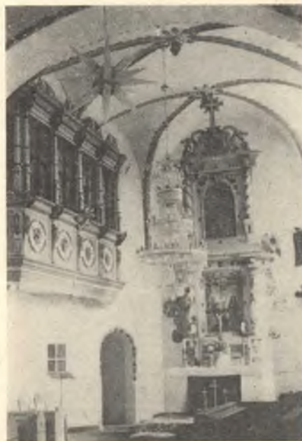
Cyrkej w Nosacicach

1940 zemrě w Budyšinje, pochowany w Hodžiju