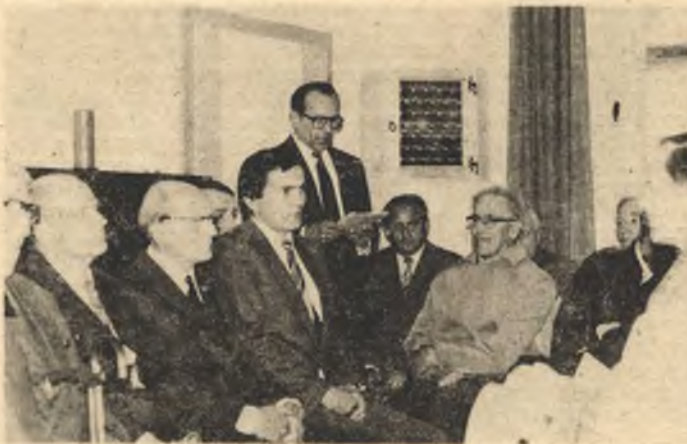
Při sobotnišim zeńdženju na farje

Připóldniša přestawka bě wupjelnjena z wjesolym spěwanjom a krótkimi přinoškami. Wosebity zajim