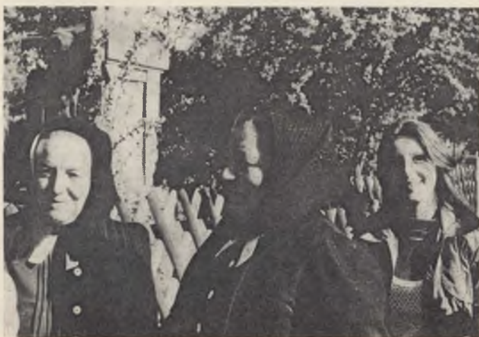
Wosadny džěń 1985 w Slepom. Hač so lětsa tam zaso wijdžimy?