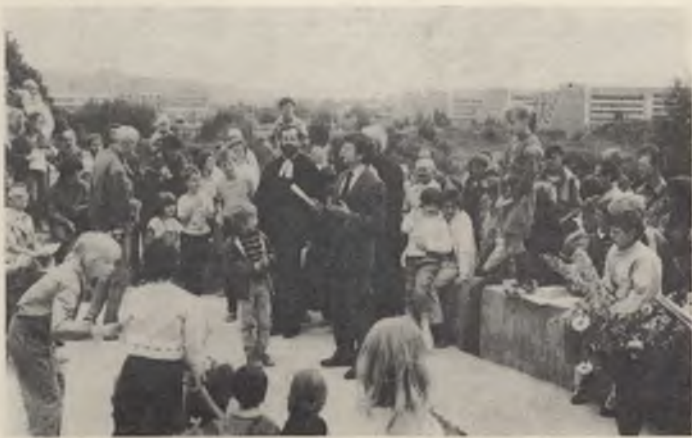
Při položenju zakładneho kamjenja

Džensa, 23. junija 1988, položimy zakładny kamjeń za tutón wosadny dom.