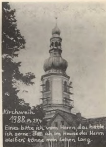
Cyrkej w Bukecach