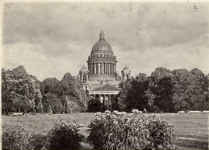
Katedra Izaaka w Leningradze, z lěta 1929 muzej

Křćenca wotměwa so we wosebitej rumnosći. Stej dvě formje křćenicy: Stož so wukřćije, so pak z wodu polije, pak so skrótka cyły pod wodu podnuri.