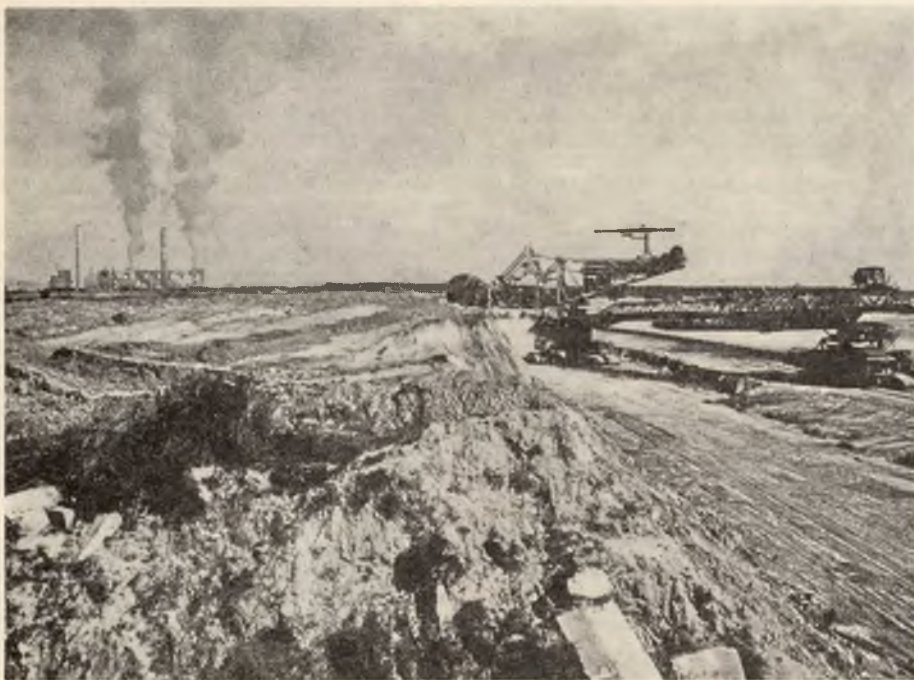
Wšudžom so wuhlo wudobywa kaž tu pola Belchatowa w Pólskej. W přichodnym čisľe chcemy nastawć k tomu wozjewić.

14.00 hodž. kemše w Budestecach (Albert)