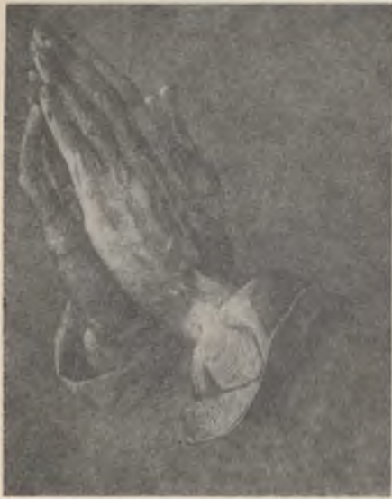
Dürer: Modlacej ruce