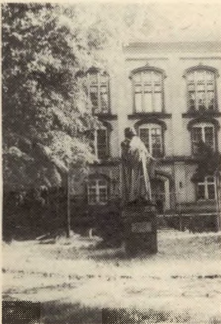
Lutherowy pomnik w Budyšinje