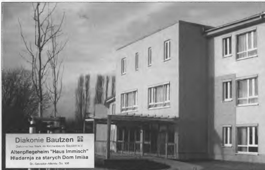
Dom Imiša – nowa hladarnja za starych ludźi na wuchodnej kromje Budyšina. Tafla před domom ma tež serbski napis.