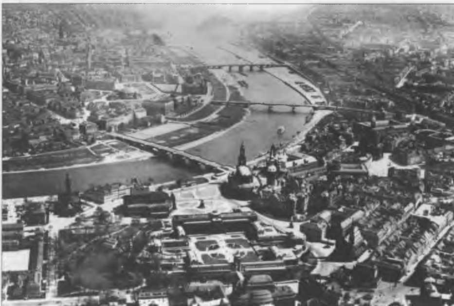
Rjane a swětostawne Drježdžany do 13. februara 1945