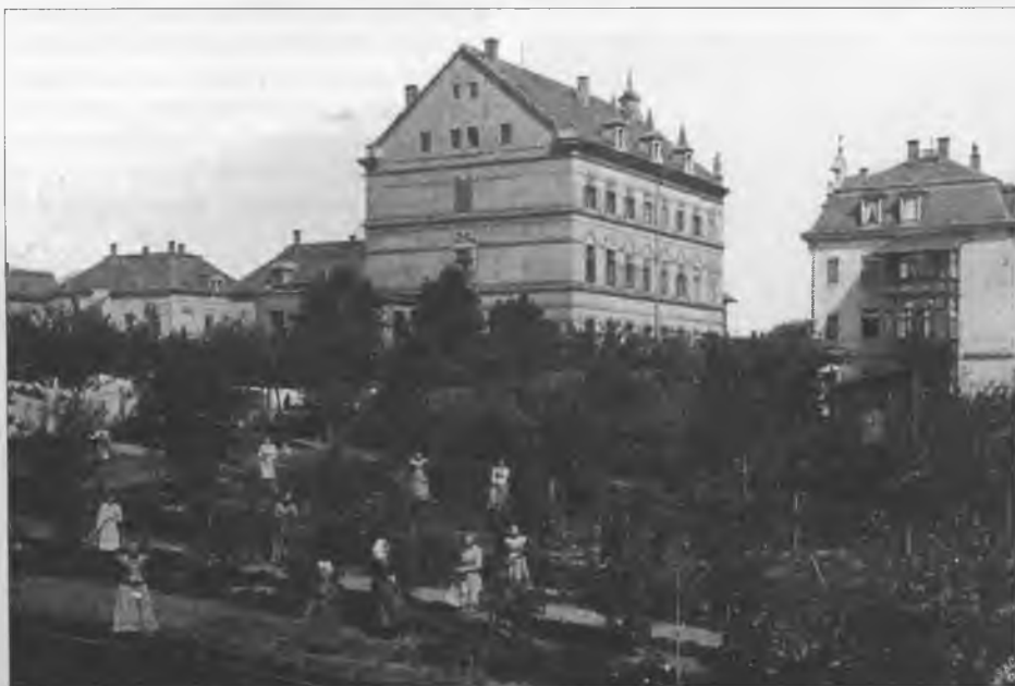
Marćiny wustaw w Budyšinje, před nlm holcy wustawa při džěle w zahrodze – pohladnica něhdže z lěta 1910