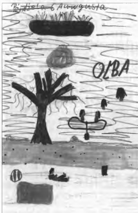
Kupanje w Olbje so wšěm lubješe, kaž je to namolowała Sofija Bejmakec.

Hdy? wot 6. do 10. awgusta 2007 Hdže? we Wukrančicach Štó? 9 hornjo- a delnjoserbskich džěci, 3 nawoźa Što? stawizna Rut, nutrnoće w cyrkwi, wšědnje kupanje w Olbje a k temu wjele rjaných wulětow a dyrdomdejow