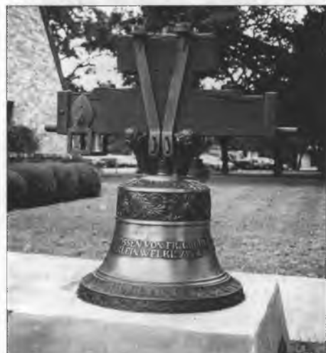
Na kampusu uniwersity Concordia je postajeny wusluženy zwón z cyrkwyje w Serbinje, laty w lěće 1854 w Gruhlec zwonyljierni w Małym Wjelkowie.

Dalše plany předwidža přesydljenje uniwersity wot něčičeho městna w centrumje Austina na nowy campus, kiž leži 40 mjeńšín na zapad wot města. Nowy campus bě prjedy wukubłanski centrum francoskeje firmy Schlumberger, kotraž po wšém swěće za wolijom toči. Na 300 acrach tuteje le-