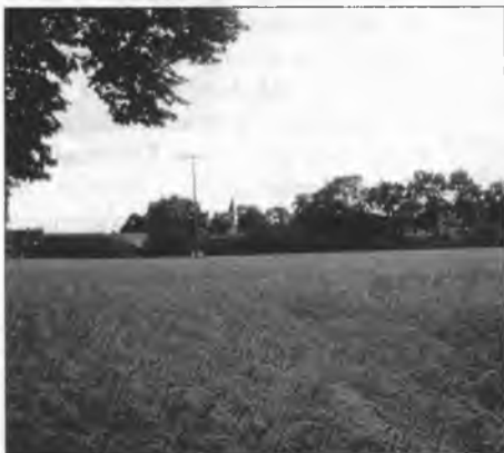
Tež lětsa mējachmy zaso žohnowane žně, kaž tule na zahonje pola Sprjejc.