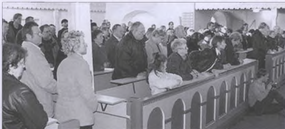
Na 170 kemšerjow bě so w Žylovskej cyrkwi zhromadźiło k introdukciji nowych delnjoserbskich spěwarskich.