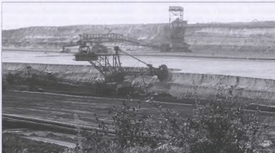
Wuhlowa jama hrozy spözěrać wsy Slepjanskeje wosady.