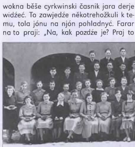
Bukečanscy konfirmandža ze superintendentom Mjerwu w lěće 1916