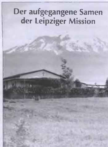
Knihla wo skutkowanju misionara Müllera, spisana wot fararja Kecki a wudata wot Rakečanskeje wosady

a zgwałćenje tamnišnjeje kultury. Zložuju so na konkretne fakty wotwobara načasne wumjetowanja jako njewoprawnjene.