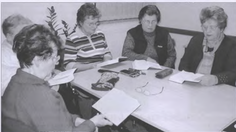
Wjesnjanki na bibliskim kruhu w Miłorazu w Slepjanskej wosadze

Potom, 1997, začahny po kóncu brunicoweho nakładowanja nadobo čišina do wsy. „Měra dla njemóžach naraz wjac spać“, dopomni so křescánka. W Miłoraskim bibliskim kruhu Slepjanskeje wosady rozbudža tema „jama“ wšěch. Do lěta 2045 chce Vattenfall kompletnje Rowno,