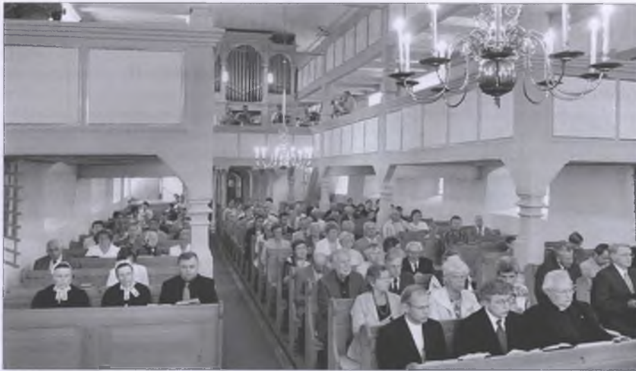
Na 150 kemšerjow bě so zhromadźilo k swjedźenskej Božej službje njedźelu dopódnja w Rakečanskim Božim domje.