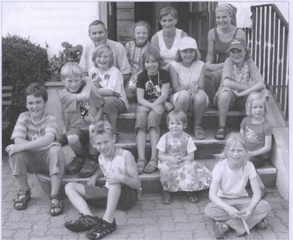
Dobra zhromadnosć džěći a dorosćenych – wobdžělnicy na lońšim serbskim nabožnym tyždźnju we Wukrančicach

Wědomostnicy wotwodžichu ze swojich wobkedźbowanjow daloko sahace prognozy. Woni měnja, zo steji naš swět na spočatku wulkeje nabožneje žołmy. Tuta nastanje prosće z toho, zo maja ći nabožni wjace džěći a wěru swojim džěćom dale dawaja. Njeje pak prajene, zo budže křesćanstwo slušec k dobyčerjam nabožneho rozmacha. Ličba džěći w křesćanskich krajach je niša hač ta w islamiskich krajach. Islam přibywa, dokelž maja swójby wjace džěći.