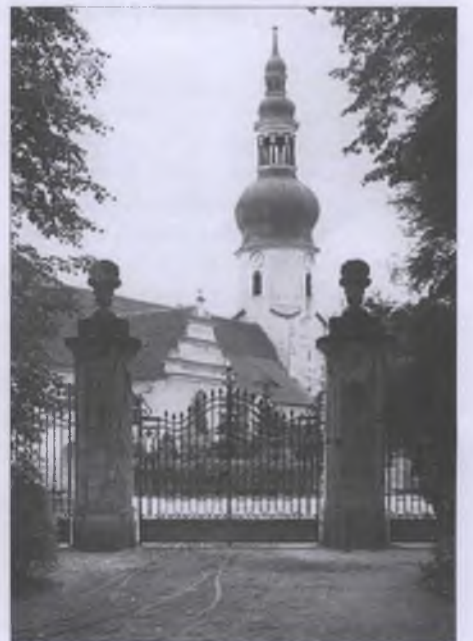
Cyrkej w Njeswačidle do swogeho zniženja w aprylu 1945

W měrcu 2005 je so spěchowanske towarstwo založilo. Wone pomha wosadze pjenježne srědky za projekt hromadzić. Z tuteho časa je so hižo tójšto nazběrało.