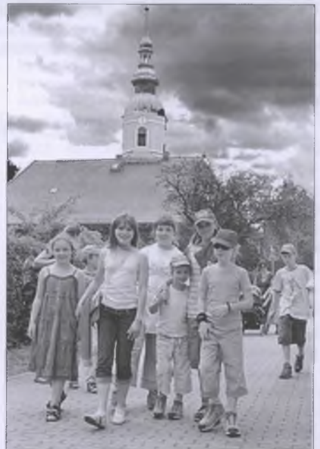
Džěci z někotrymi staršimi podachu so na pućowanje z Rakec do Kamjenjeje.