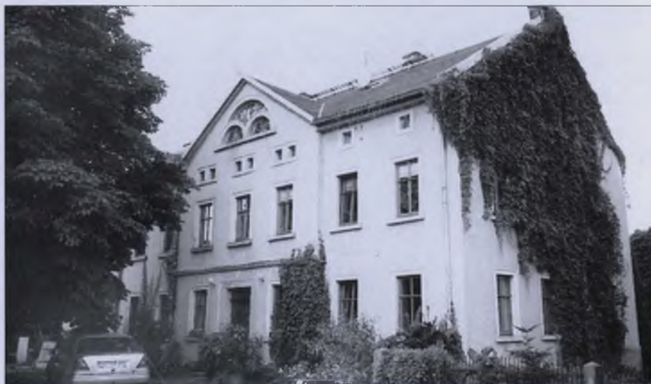
Domske na kuble Jana Smoły w Spytecach

Jědžeš-li z Bolborc do Lešawy, nadpadnje či w křiwicy na započatku wsy samotnje