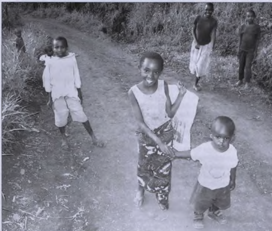
Džěci w Tansaniji. Z tamnišimi wosadami haji Budyski cyrkwinski wokrjes partnerstwo a podpěra twar cyrkwjow, wodowodow, chorownjow a šulow.