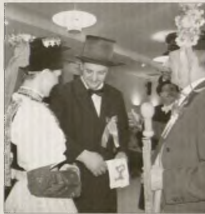
Brětnjanscy předstajichu hosćom z Texasa serbski kwas.