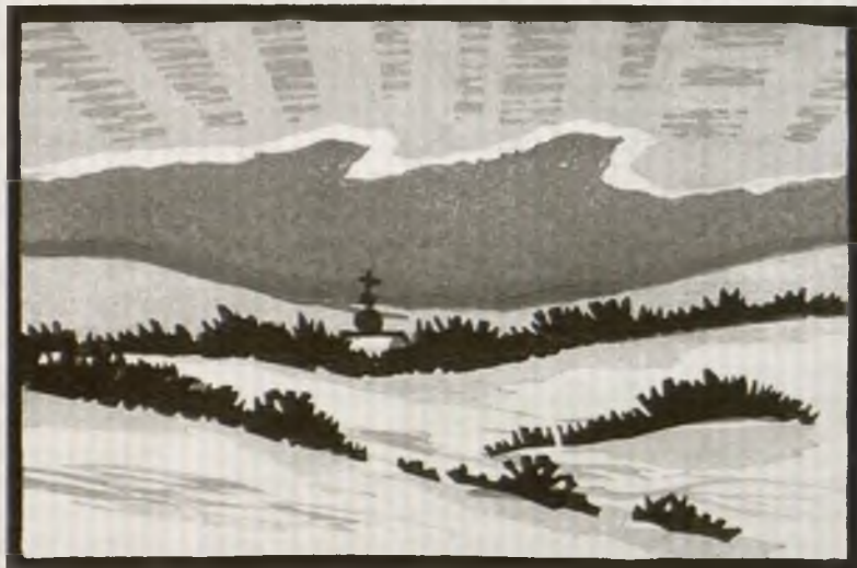
Krasna Boža stwórba – krajina w zymskej pyše

zaleži na jeho žohnowanju. Hdyž te nimamy, tak nam tež wšitke bohatstwo njepomha. Bóh popřeje nam naše žiwjenje. Swoje bohatstwo mamy widžeć jako dowěrjeny dar, z kotrymž mamy rozumnje wobchadžeć. Biblija sej nježada wuswojenje a wotedaće. Ludžo, kiž su spytali wšitko sprawnje rozdželić z tym, zo bohatym swójtwo zebrachu, su na kóncu dowjedli wšitkich do hubjenstwa. Jich čas je nimo. Wostanje pak naš naddaw, spóznać Božu wolu tež za naše materielne wobsydstwo a so jemu