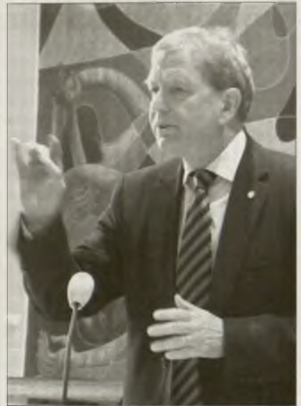
Sakskej krajny biskop Jochen Bohl při swojej rozprawje na synodze

Sobotu su so synodalni člonojo cyrkwinskeho wjednistwa a sakskej zastupjerjo VELKD- a EKD-synody wolili. Tohorunja je so zličbowanje za lěto 2007 we wysokosći