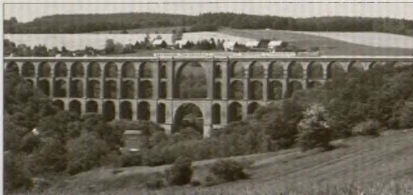
Vogtlandska krajlna ze znotym most přez dolinu rěki Göltzsch