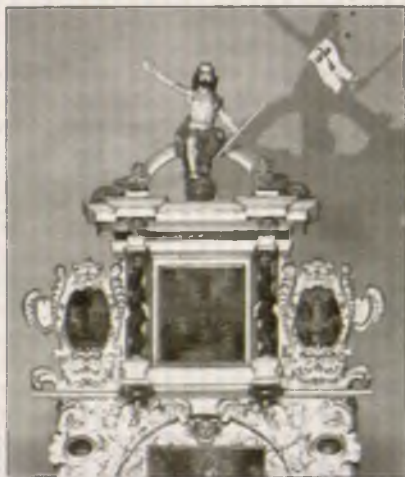
Wjeršk Łazowskeho woltarja pokaza Jezusa jako Knjeza swěta

W lěće 1836 darištaj cyrkwinski patron a wosada Božemu domej nowe drjewjane křćenske blido. Džensniša dupa, přez dary