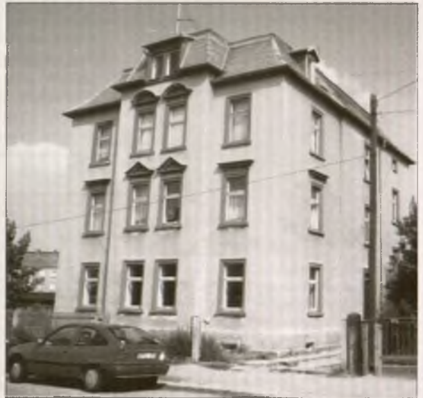
Dom na Wjelčanskej 5 w Budyšinje, w kotrymž ma swobodna bratrowska wosada swój domicil

Katolska kaž ewangelska cyrkej prajitej, zo stanje so čłowjek přez křćeńcu z křesćanom. My prajimy hinak: Najprjedy ma so čłowjek wosobinsce za wěru rozsudzić a so potom wukřćić dać. Katolska cyrkej ma sydom sakramentow, ewangelska dwaj. My wotpokazujemy sakramenty jako srědk hnady. Jenički srědk hnady za nas je Chrystusowa krej a wuznaće winy před Chrystusom. Njeznajemy Bože wotkazanje jako srědk k wodawanju hrěchow, swjećimy je