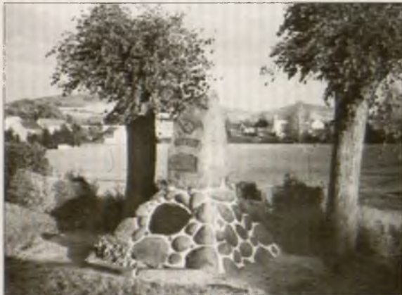
Pomnik za padłych Prěnjeje swětowej wójny na pohrjebnišću w Mnišonc