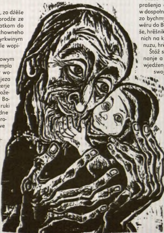
Wobstarny Simeon wza młeho Jezusa na ruce a spózna w nim Zbóžnika swěta – drjeworěz Waltera Habdanka.