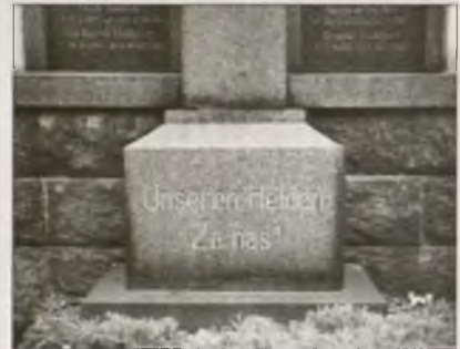
Dwurěčny napis na pomniku za padłych Prěnjeje swětowej wójny w Džěžnikcach

přiwuzni ze swojim wotnamakanjom přezjedni a lěta dolho procesy před sudnistwom wjedžechu. Tež potom pak so wudžělenje hišće njezapoča, dokelž bě so mjez tym Łužica 1815 džělila a mějachu so tuž podžěle wotkazanja za Serbow w Pruskej a Sakskej wuličić a postajić. Wupłačowanje pjeněz z lětnych dani započinaše so hakle w lěće 1833 a traješe hač do časa inflacije po Prěnjeje swětowej wójnje. Pjeněz za pomnik hromadžachu so po cyłych Serbach (219 tolerjow). Wotkryli su čežki zornowcowy pomnik 2.10.1867 w přitom-