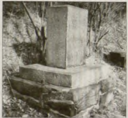
Serbski Lutherawy pomnik na swojim přěnjotnym městnje w Debsecach