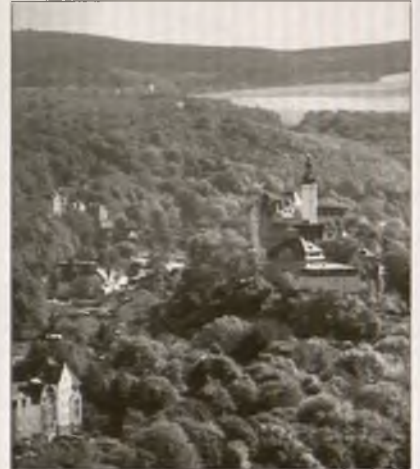
Pohlad na hród a město Greiz

„Endlich stützt sich diese Behauptung auf eine andere Sage von sogenannten