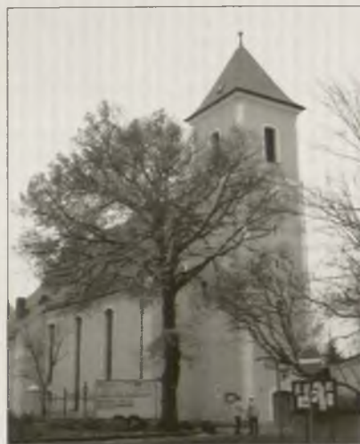
Wobnowjeny Boží dom we Łazu

Štyri lěta pozdžišo, 1921, dósta Łazowska cyrkej tři nowe zwony. Mały zwón z lěta 1843 dachu pozdžišo do Běleho Chołmca do kapoty tarnišeho kěrchowa. W januaru 1942 dyrbjachu Łazowčenko zaso srjedžny