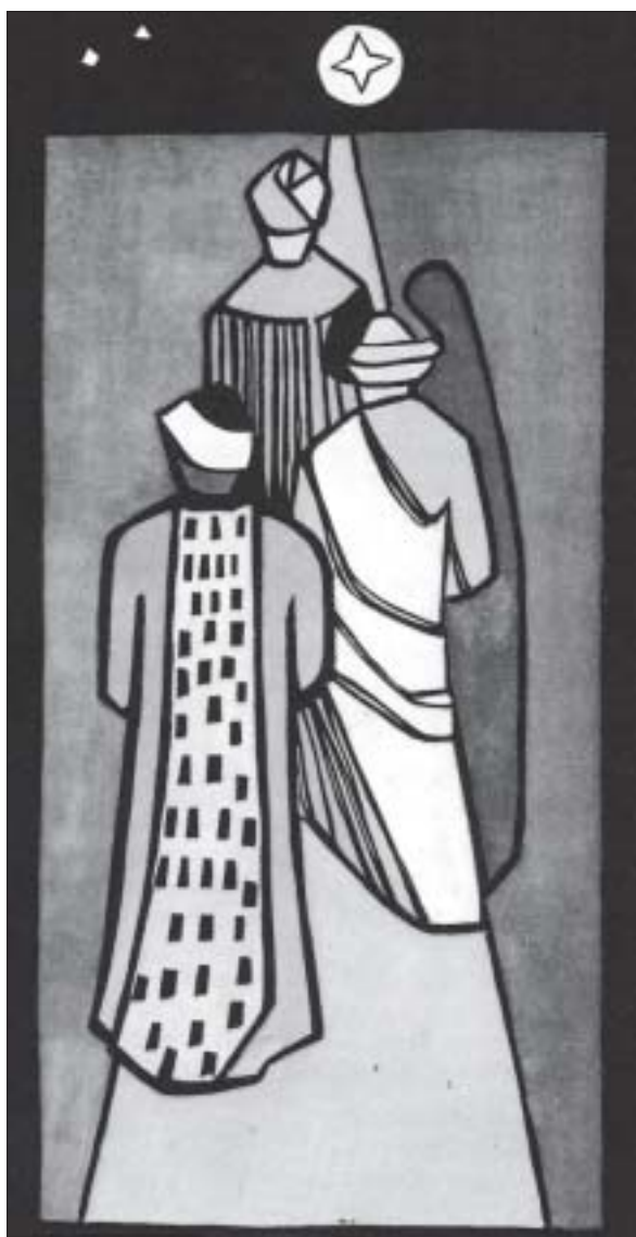
Třo kralojo ducy do Betlehema. Woni so strachow puća njebojachu, ale nastajichu so poñni dowěry na puć k nowonarodženemu Jezusej.