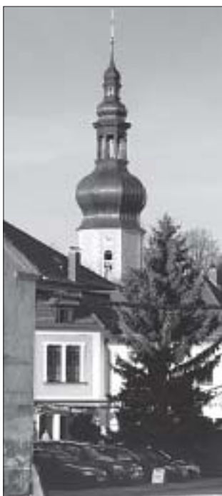
Njeswaćidło na dnju poswjećenja nowje wěže