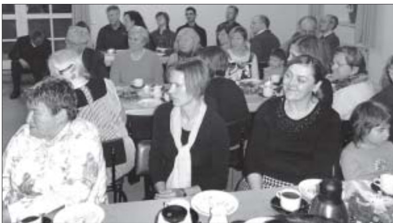
Kedźbliwje scěhowachu wosadni wot džěći wuhotowany program.