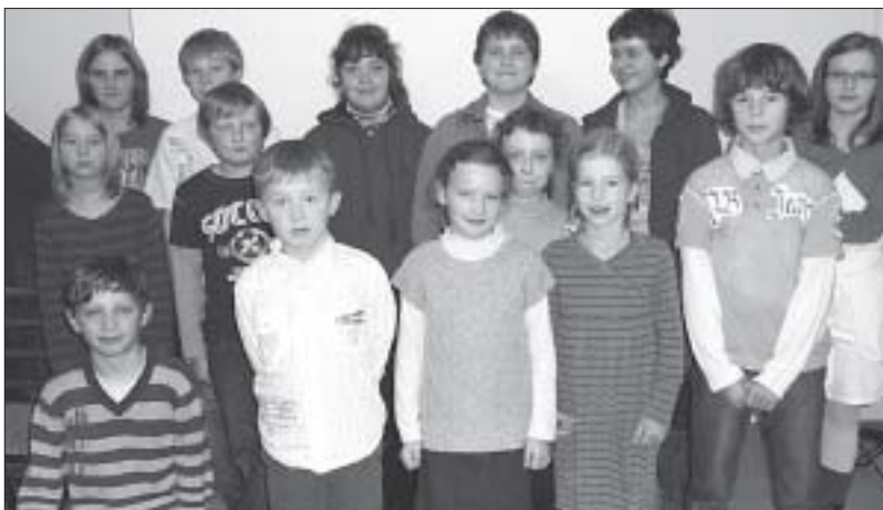
Po programje zestupichu so mali wuměłcy, kiž běchu hodowne natožki w europskich krajach předstajili, k skupinskemu wobrazje.