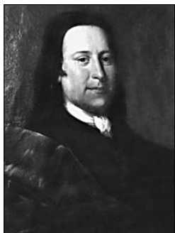
Nikolaus Ludwig hrabja von Zinzendorf