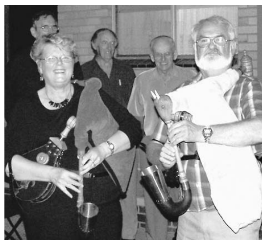
Na nedawnym zeńdženju Wendish Heritage Society Australia w awstralskim Dimboola zahraštaj Hufec mandželskaj na měchawje a kozole serbske štučki.

Instrumentaj, měchawa a kozoľ, pochadźatej z lužiskeho Zemichowa pola Hodžija z džěłarnje mištra Jensa Güntzela a stej hakle wot hód 2009 sem we wobsyd-