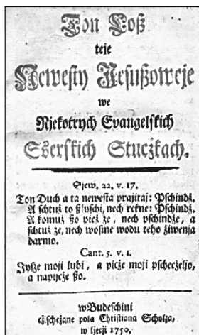
1750 wot Hersena wudate serbske Ochranowske spěwarske Repro: SKA (2)