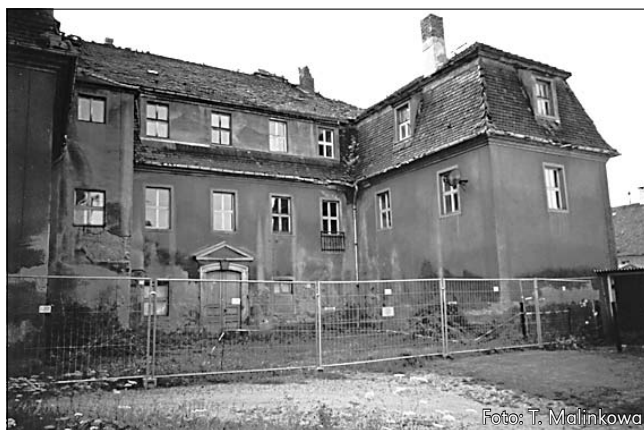
Hród w Čichońcy, přenje srjedžišće Ochranowskich w Serbach, steji hižo doľho prózdy a je džeľna w bėdny m stawje.