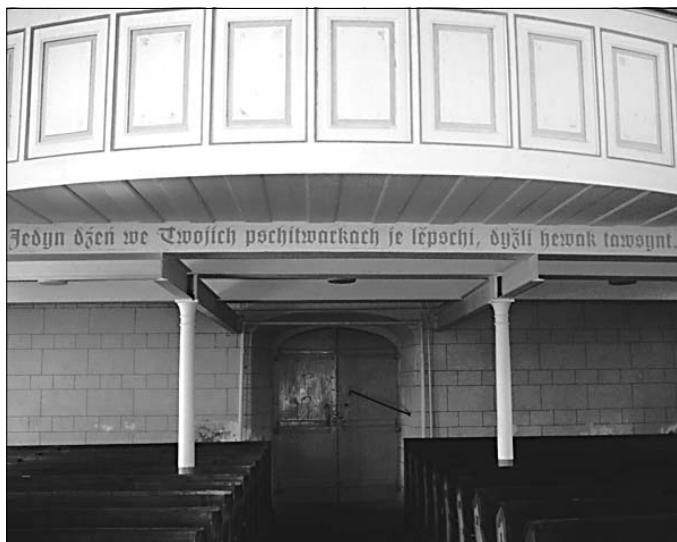
Znowa wotkryte a wobnowjene bibliske hrono w Bukečanskim Božim domje