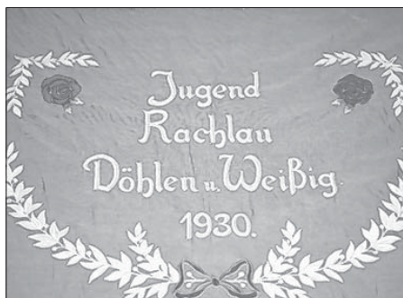
Młodžinska chorhoj z léta 1930 ma na jednym boku němski, na tamnym serbski napis.

Po rozprawje w Tydženskich Nowinach zhotowichu so tajke młodžinske chorhoje přeni raz skladnostnje znowaposwjećena nutřkownje wobnowjeneho Bukečanskeho Božeho domu w léce 1856. Wjele lět so wone wužiwach a so počasu z nowymi narunachu. Tak bu w léce 1930 młodžinska nowa chorhoj za wsy Rachlow, Delany a Wysoku zhotowjena. Došlo wšak tuta swoju službu wukonjeć njemóžeše, dokelž so jeje serbski napis bórže hižo nječerpješe. Hinak hač druge młodžinske chorhoje, kotřež so w Bukečanskej cyrkwi chowachu, skladowaše so Rachlowska chorhoj na łubi