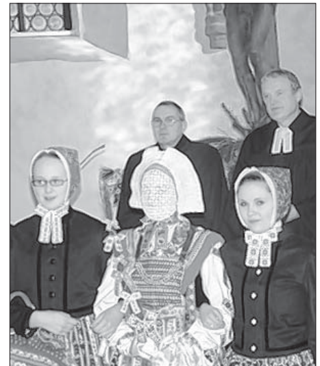
Serbski superintendent Malink a Niščanski superintendent dr. Koppehl wužohnowaštaj džěćetko a jeho přewodžerku.

Na kemšach 1. adwenta w Slepom wužohnowaše so tež džěćetko, kotrež we wsej hodowne žohnowanje do domow njese. Hromadže z přewodžerkomaj přińdže wone tež na serbske wosadne popołdne, kotrež so po dopołdnišich wužohnowan-