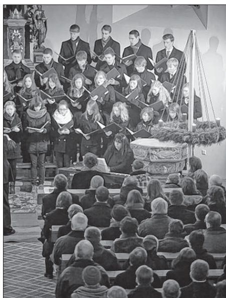
Chór Serbskeho gymnazija wuhotowaše hižo 19. raz adwentny koncert w Budyskej Michalskej cyrkwi.