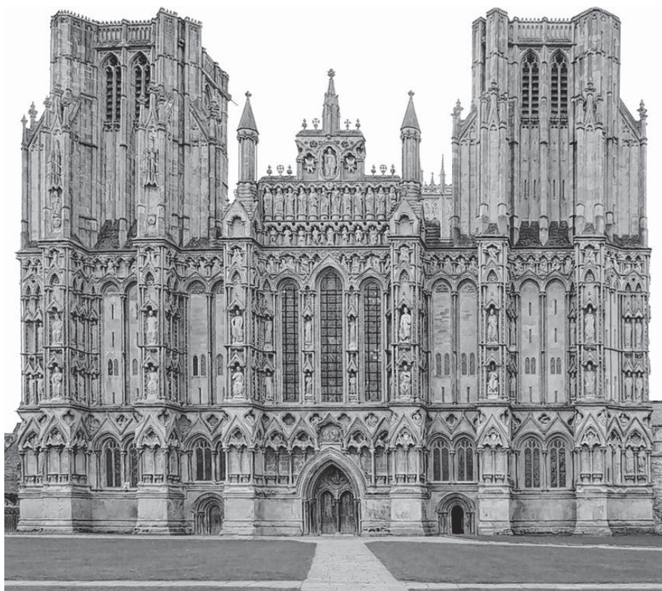
Katedrala w jendzelskim Wellsu. Z rěču architektury posrědkowaše so poselstwo, zo předstaji Boži dom symbolisce njebjeski Jerusalems. Po přenjatnych planach měještej so weži wysoko do njebja pozběhować, wonej pak so njeještej dotwariťoj.

Tole nam wobkrućeja wjacore městna w Swjatym pismje. Japoštoł Pawoł pisaše wo Jerusaleme, „kotryž horka je“, w kotrymž knježi swoboda a kotryž je nam kaž mać, ke kotrež směmy so wrócić (Gal 4,26). Tež na dalších městnach biblije namakamy pokiwy na njebjeske město, w kotrymž budžemy něhdy přebywać. Widžer Jan je widzał njebjeski Jerusalems, kotryž Bóh z njebjes dele sčele: „Widžach swjate město, nowy Jerusalems, wot Boha z njebja přińć, přihotowane kaž wupyšena nje-wjesta za swojeho muža. A slyšach wulki hlós wot tróna, kotryž rěčeše: Hlej, Boža hěta pola čłowjekow!“ (Zjew 21,2-3). Smě-