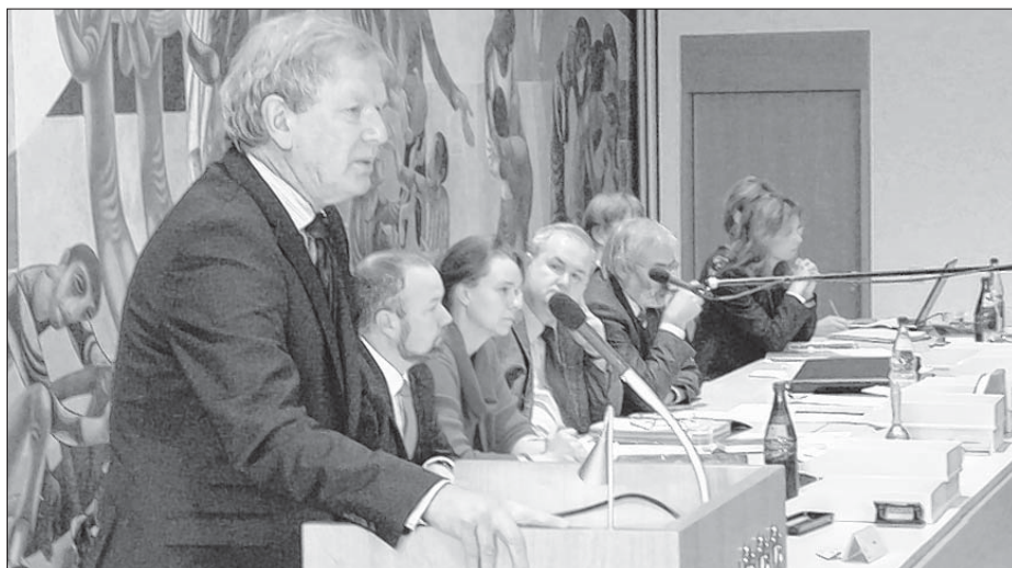
Biskop Jochen Bohl přednošowaše na nazymskim zeńdženju krajneje synody.

Přednošk biskopa Jochena Bohla 17. nowembra 2012 na krajnej synodze w Drježdźanach