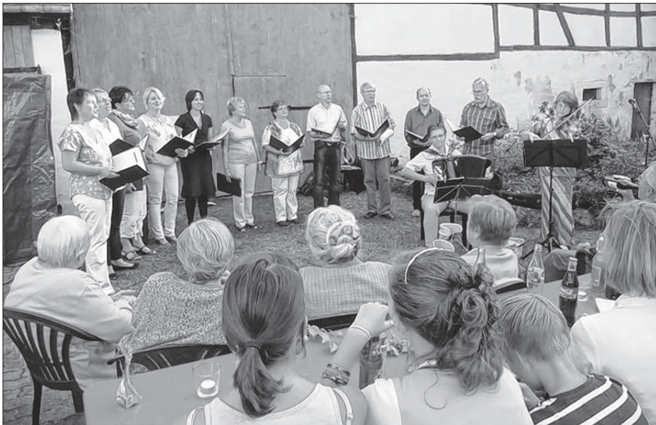
Chór Łužyca z Choćebuza zanjese delnjoserbske a dalše słowjanske pěsnje.