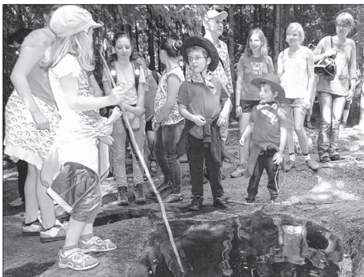
Pućowanska přestawka při Čertowym myjadle