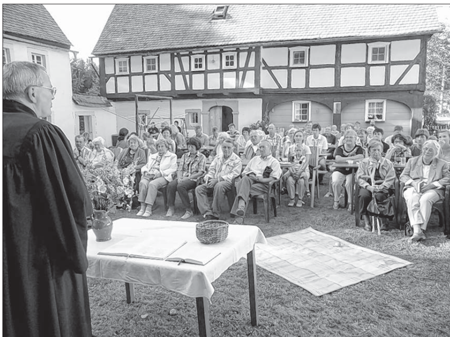
W zhromadnosći sabat swjećić – kaž njedawno na dworowym swjedženju na Dejek/Pawilkec statoku we Wuježku pod Čornobohom

– na přikład za wobstaranje skotu – běchu jasnje postajene. Nimo tutych njeběchu žane dalše wuwzaća móžne. Jezus pak so tež na sabaće z chronisce chorými zetka-waše, kotřiž jemu swoje horjo a swoju nu-zu wuskoržichu. Dyrbješe Jezus hač do přichodneho dnja čakać, zo by směł jim pomhać a jich wuhojić? Farizejojo prajachu jasnje: Haj! Dołhož njebě žadyn akutny strach wo žiwjenje, by Jezus dyrbjał hač do přichodneho dnja čakać.