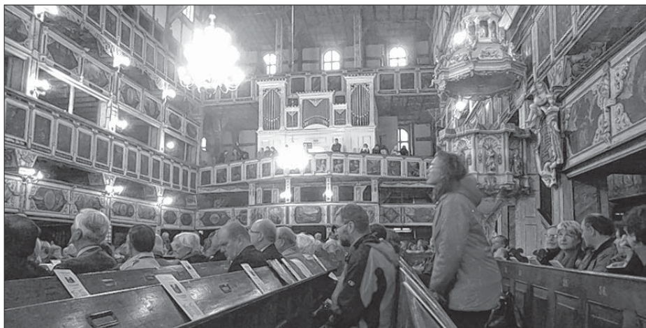
Kemše w Jaworskim Božim domje