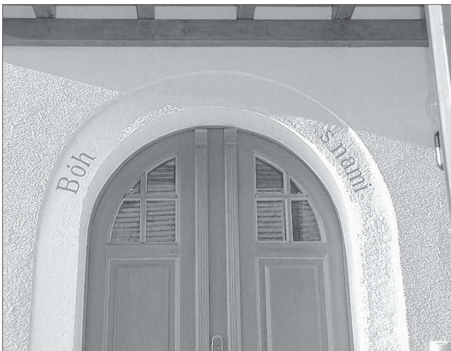
„Bóh z nami“ – wobnowjeny napis nad chěžnymi durjemi něhdy serbskeho burskeho stotoka w Šešowje pola Njeswaćidla