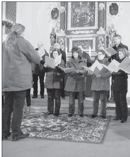
Chór Budyšin zaspěwa w Budyskej Michałskej cyrkwi.

By derje było, by-li so němsko-serbske adwentne spěwanje z tradiciju stało. Snadž pak móhlo so na třeće adwentnej nježděli wotméc. Tak bychy sej Serbjka móhli na nježděli drugeho adwenta wobchować swoju tradicionalnu serbsku adwentničku. T.M.