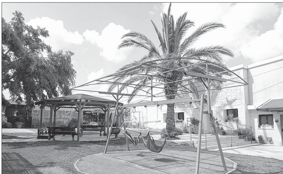
„Maon Carmel“ – w tutym domje bydli 70 zbrašenych w starobje mjez 21 a 35 lětami, rozdželenych na wosom apartmentow.