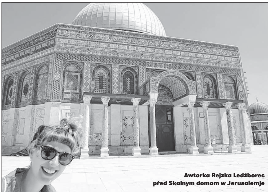
Awtorka Rejzka Ledźborec před Skalnym domom w Jerusalemje

Sym 38 hodžin wob tydžen w „Maon Carmel“ džěłała a so do teama z 60 hladarjami derje integrowała. Zhromadnje z druhej dobrowólnicu započinaše so naju džen přeco ze sportowym kursom za wo-