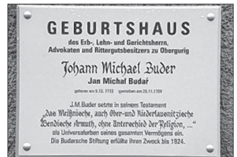
Pomjatna tafla na ródny domje Jana Michała Budarja