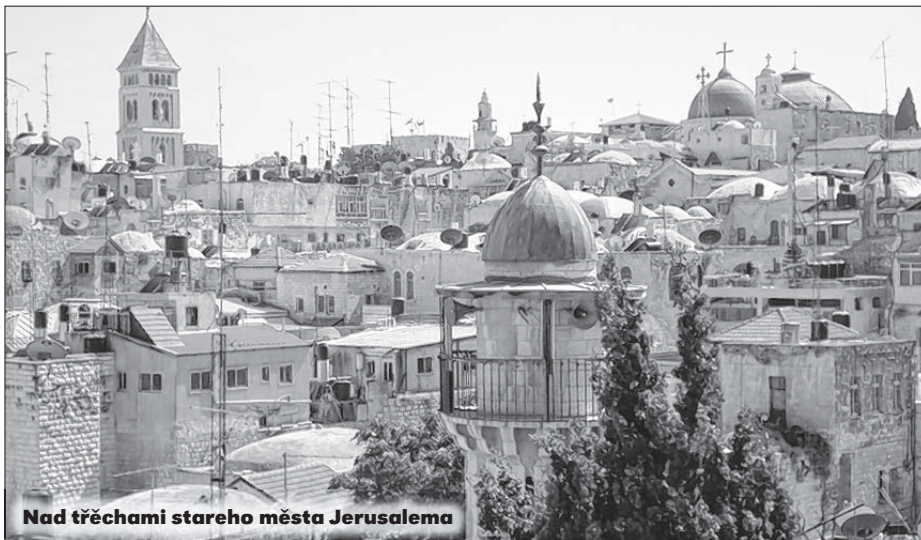
Nad třechami stareho města Jerusalema

To běchu přičiny, čehodla so spočatnje w Jerusalemjje tak derje nječujach. K tomu přińdže, zo knježi njeměr, dokelž wšitycypoprawom jenož wot jedneje modlitwy k přichodneje spěchaja a při tym na swoju wokolinu zabudu. Předawarjo će na pokoj njewostajaja a kamjenje, z kotrychž je město natwarjene, su hładke. Ale jako město časćišo wopytach, zeznach tež druge strony Jerusalema: małe urbaneke žiwjenje, kritiske grafity, zajimawe korčmy a rjane parki.