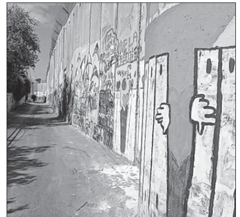
Murja wokoło Betlehema

mjenuja Tel Aviv tež „pucher“ abo „Big Orange“, dokelž sprěnja tam wo konfliktach w zbytku kraja jenož mało pytnješ a zdruha dla paralele k „Big Apple“ – New York. Nimo wysokich domow mi tute přirunowanje pak njenapadny.