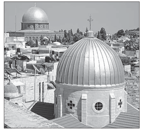
Dvě kupoli – dvě nabožiny: cyrkej (předku) a mošeja w Jerusalemjje