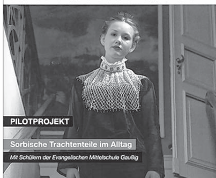
Katalog Hušćanskich srjedźnych šulerjow wo kombinaciji dźělow serbskeje drasty z načasnej modu