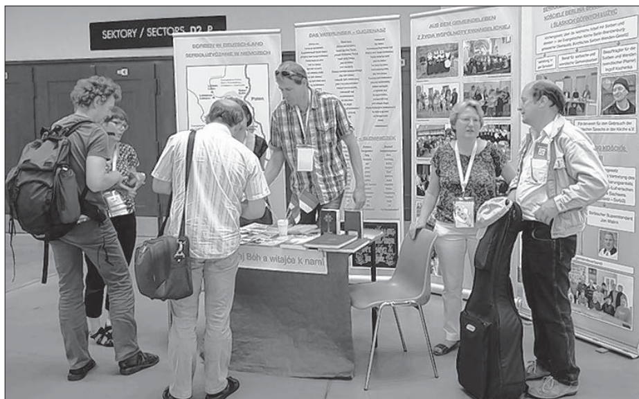
Rozmołwa z wopytowarjami při serbskim stejnišću