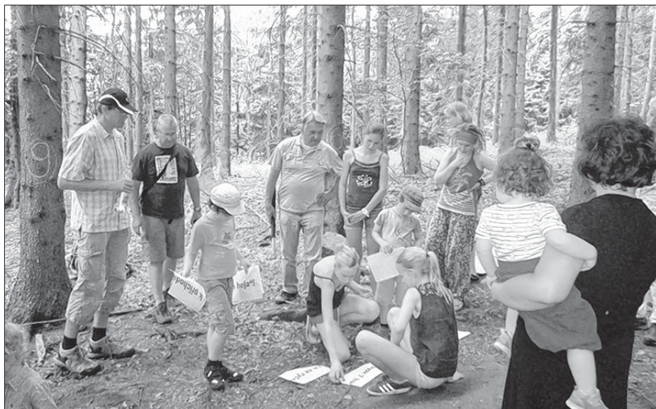
Swoje wjeselo mějachu wšitcy při dyrdomdejskej hrě wo rubježnych ryčerjach.

Čornoboha pochadžeštaj. Zhromadnje potom jeju krasne lětnje kěrlušy zanjesechmy.