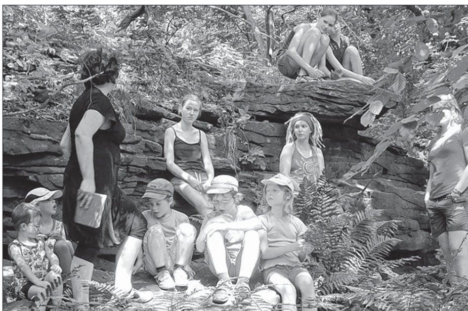
Pućowanska přestawka při Čertowym woknje